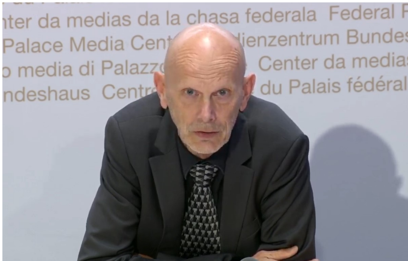
Даниэль Кох. Скриншот трансляции брифинга от 1 мая