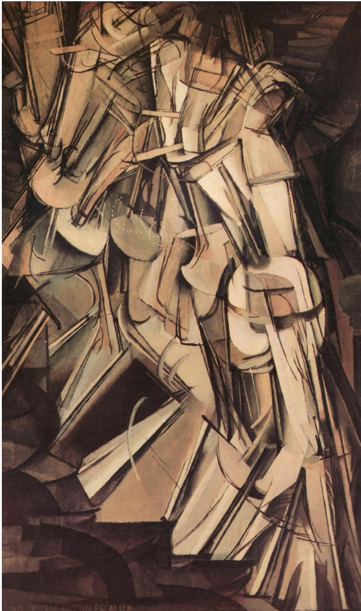
NII, DESCENDANT UN ESCALIER