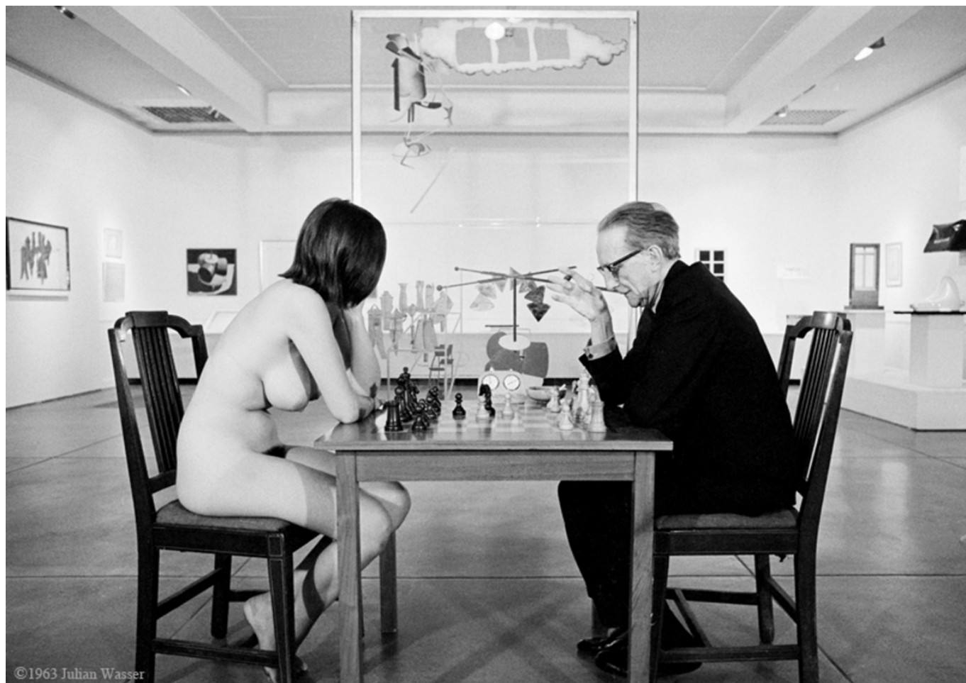
Дюшан, играющий с обнаженной в шахматы. Фотография сделана фотографом журнала Time Джулианом Вассером в 1963 году, в Пасадене

Никому из поклонников Дюшана среди его современников не сообщали, конечно, что «Фонтан» 1917 года был выброшен самим художником, а «Велосипедное колесо» (1913 г.) – один из первых его «реди-мейдов», было выставлено на помойку одной из его сестер во время уборки парижской квартиры.