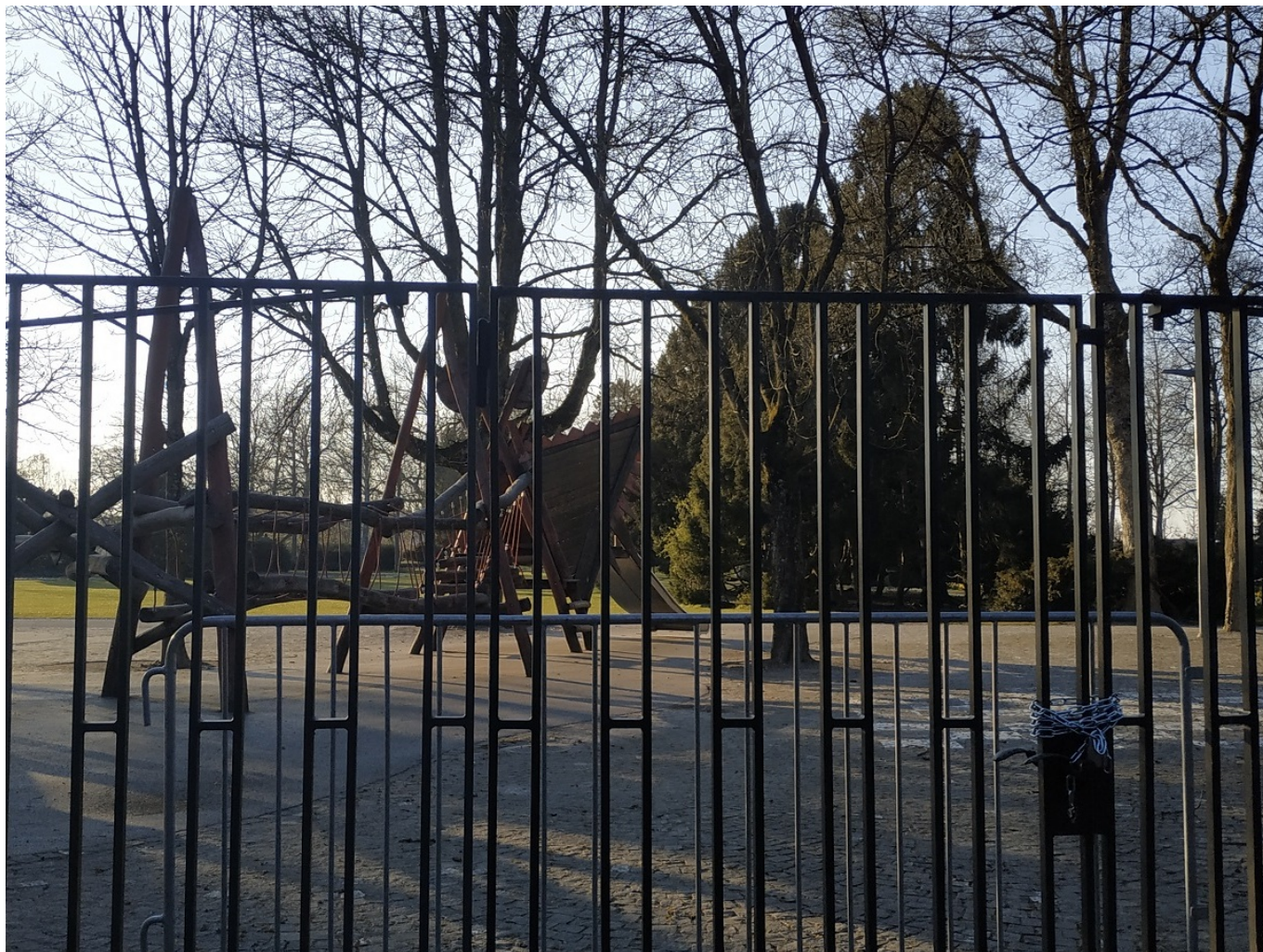
Закрытая детская площадка в бернском Розенгартене.

Впрочем, некоторые муниципалитеты выбрали другую тактику – не запрещать, а благодарить за проявление ответственности. Жителям водуазской коммуны Дайан, например, разослали 400 шоколадных кроликов. «Мы хотели сделать вам этот маленький подарок, чтобы поблагодарить вас за соблюдение строгих правил», - отмечается в пояснительной записке. Кроме того, власти коммуны этой акцией поддержали местного кондитера.