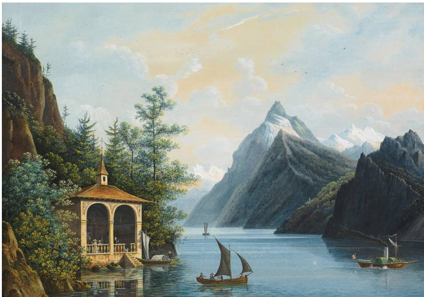
Часовня Вильгельма Телля. Гуашь. XIX век.

Auteur: Наталья Беглова, Женева , 29.11.2019.