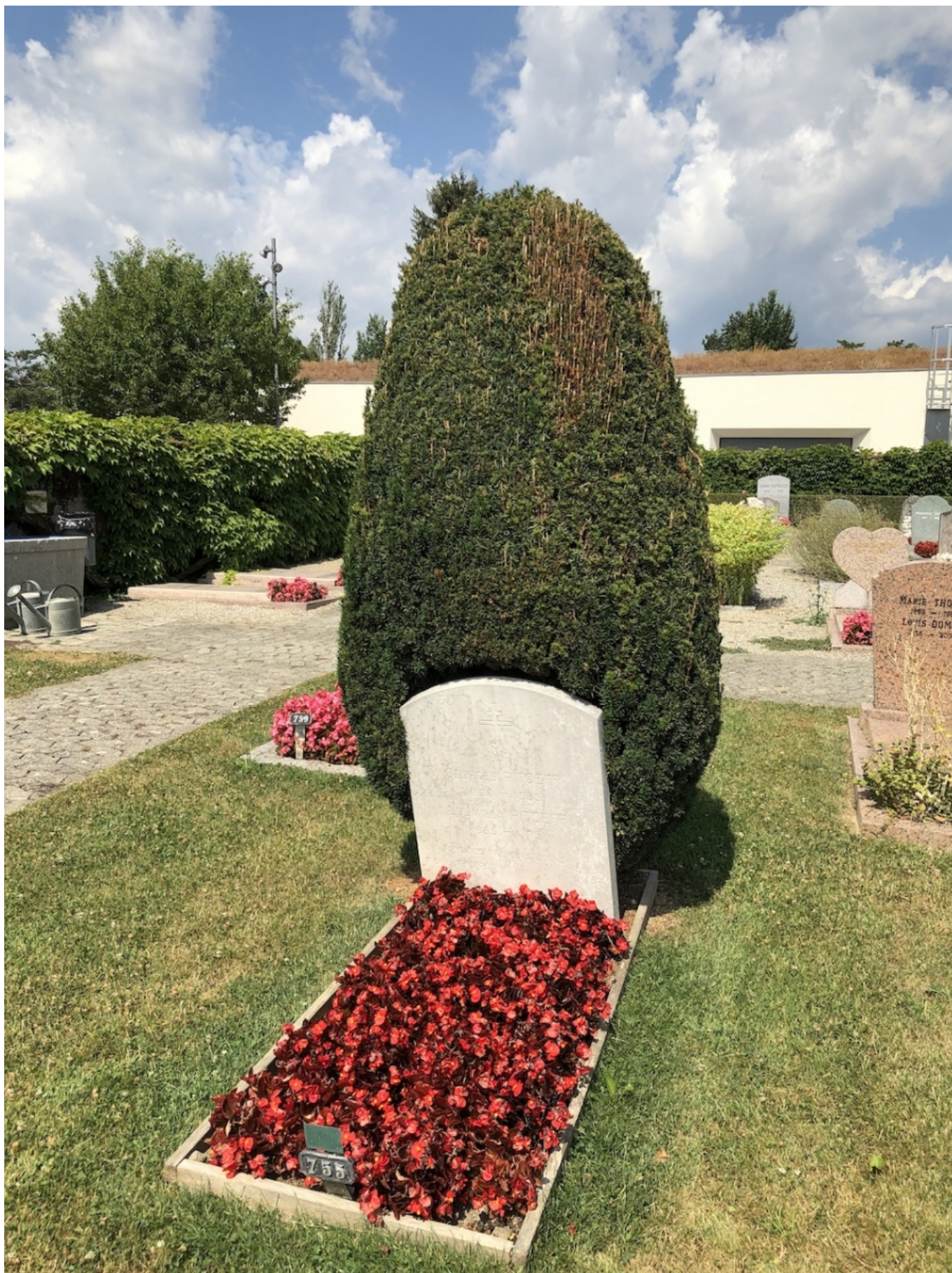
Могила Ж. и Л. Питоевых в Жанто

После смерти мужа Людмила Питоева оказалась в столь сложной ситуации, что в