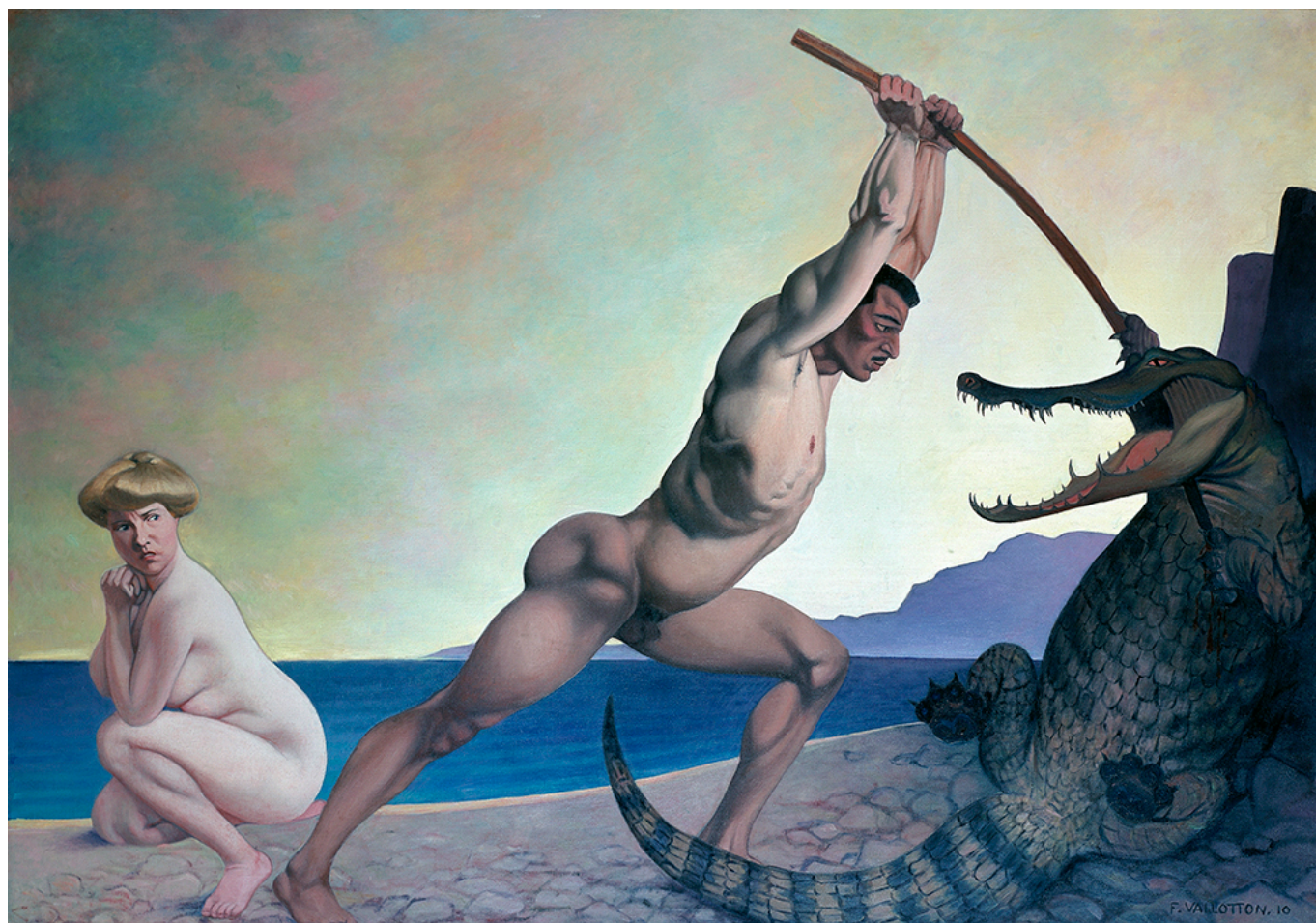
Феликс Валлоттон (1865 - 1925) Персей, убивающий дракона, 1910 Масло, холст 160 x 233 cm