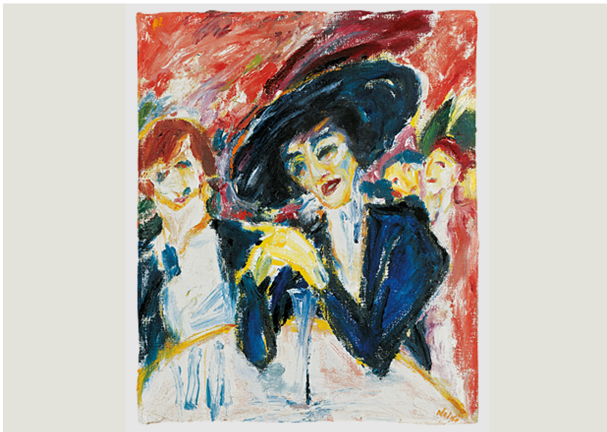
"За столиком с вином", Эмиль Нольде, 1911

писал по-другому». А объединяло их стремление порвать с академизмом, выйти за рамки традиционного искусства и найти свой художественный язык. Они оба интересовались всем экзотичным, фантастичным и гротескным. На этих трех темах в творчестве Нольде Центр Пауля Клее и сделал акцент.