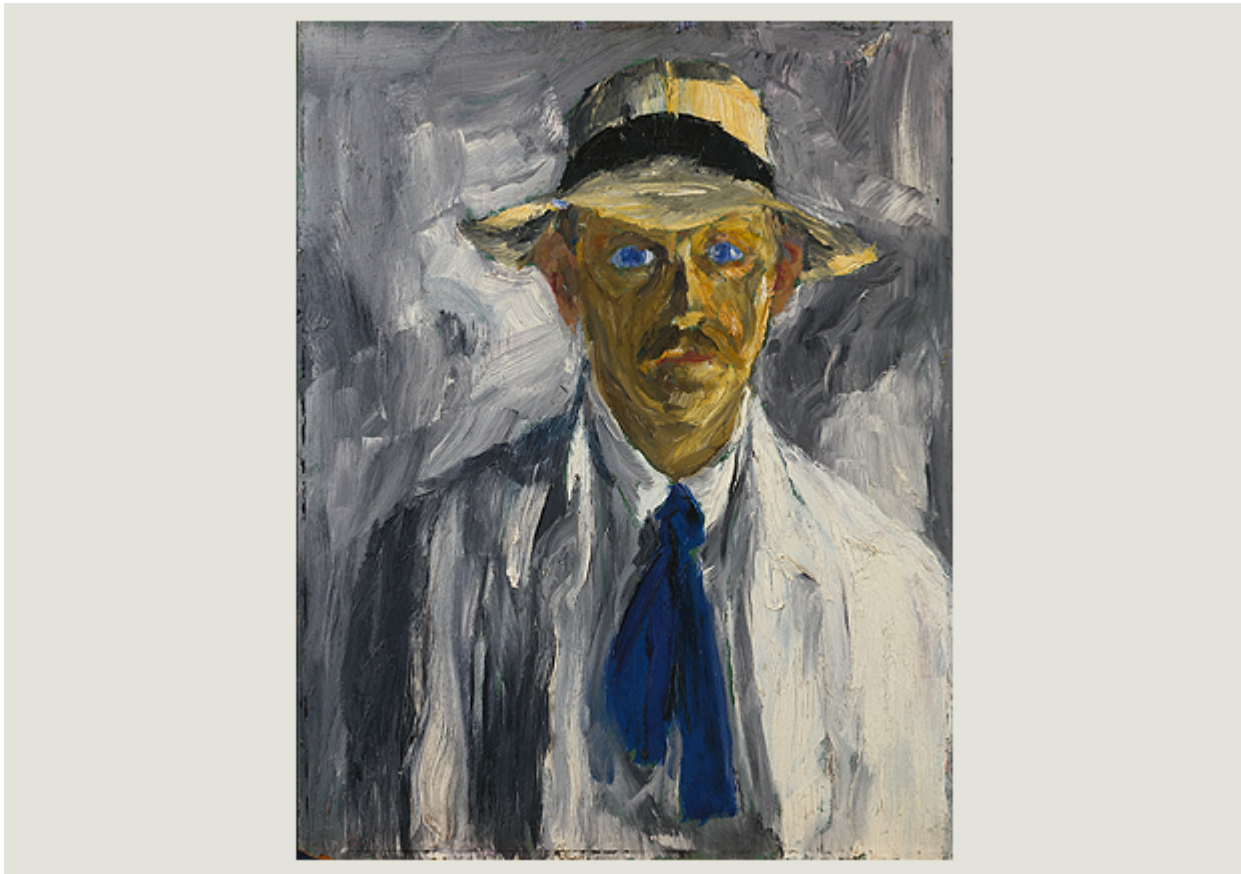
Эмиль Нольде, Автопортрет, 1917

Выставка открывается и закрывается двумя портретами Эмиля Нольде. Первый – автопортрет художника, написанный в 1917 году (соломенная шляпа, мятый светлый льняной костюм, васильковый галстук и пронзительные голубые глаза). Вторая картина – портрет Нольде, созданный его другом Паулем Клее в 1939 году (абстрактная красная креатура с зелеными волосами и теми же пронзительными голубыми глазами). Между двумя этими портретами – разница в 22 года, в течение которых Пауль Клее и Эмиль Нольде успели подружиться, отдалиться друг от друга, так как Нольде, в отличие от Клее, симпатизировал нацистам, и снова немного сблизиться после того, как Нольде стал такой же жертвой нацистской пропаганды, как и Клее. Но обо всем по порядку.