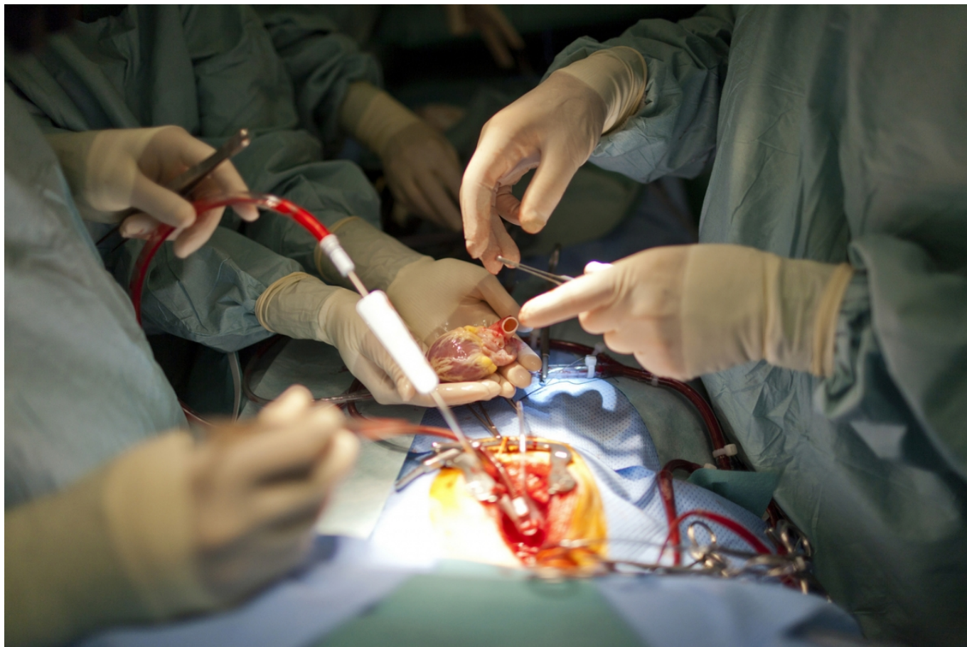
Трансплантация детского сердца

Даже зная страшный диагноз, некоторые люди, часто в силу религиозных соображений, решают сохранить жизнь ребенка.