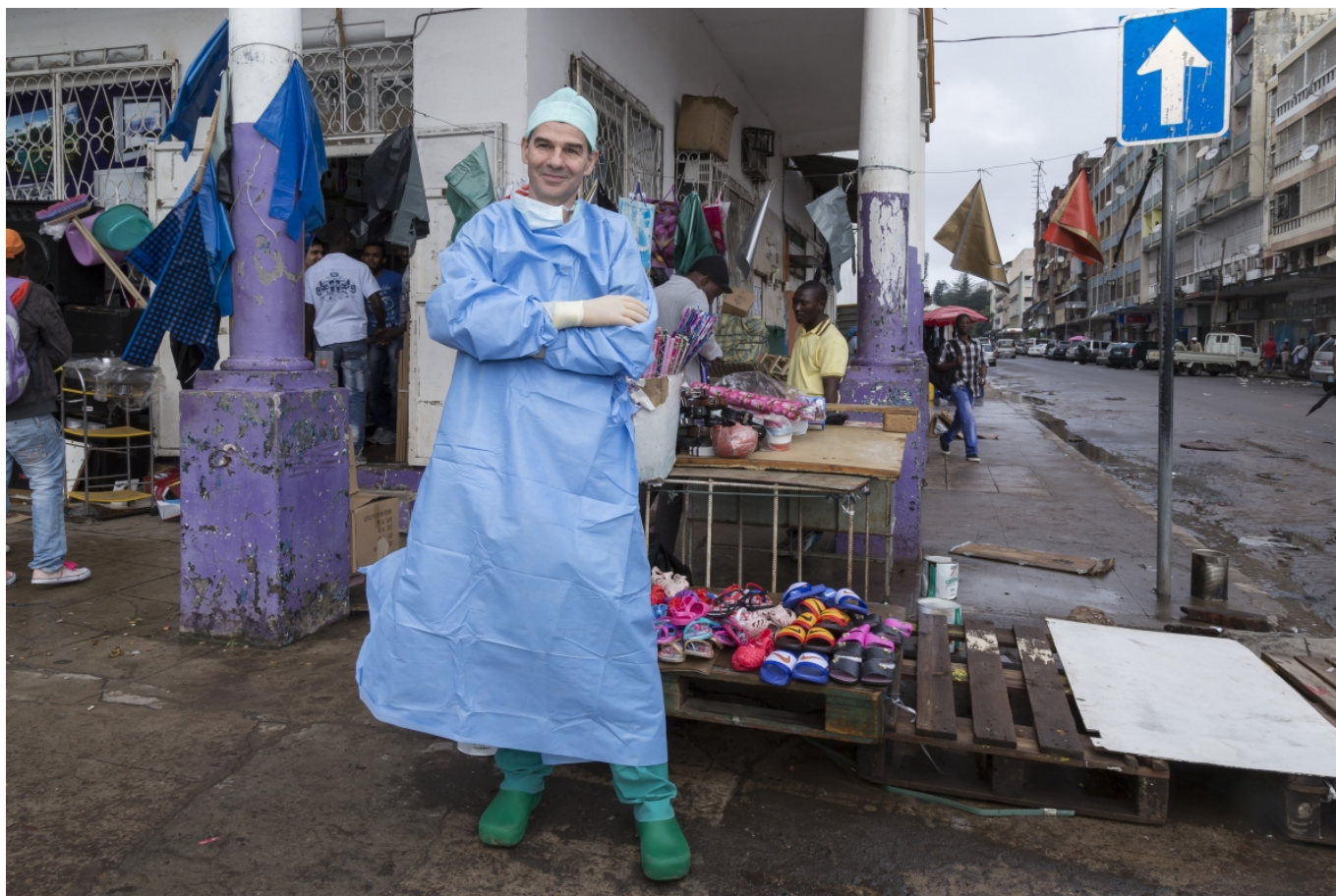
Рене Претр в Мозамбике

Обычно я попадал в Москву в декабре, останавливался в «Национале», где всегда обращал внимание на портреты французов на стенах – от Шарля де Голля до Мирей Матье. Развлекательная программа тоже варьировалась: от Большого театра до матча «Локомотив» - «Торпедо». Представьте себе, как для иностранного уха звучат эти названия!