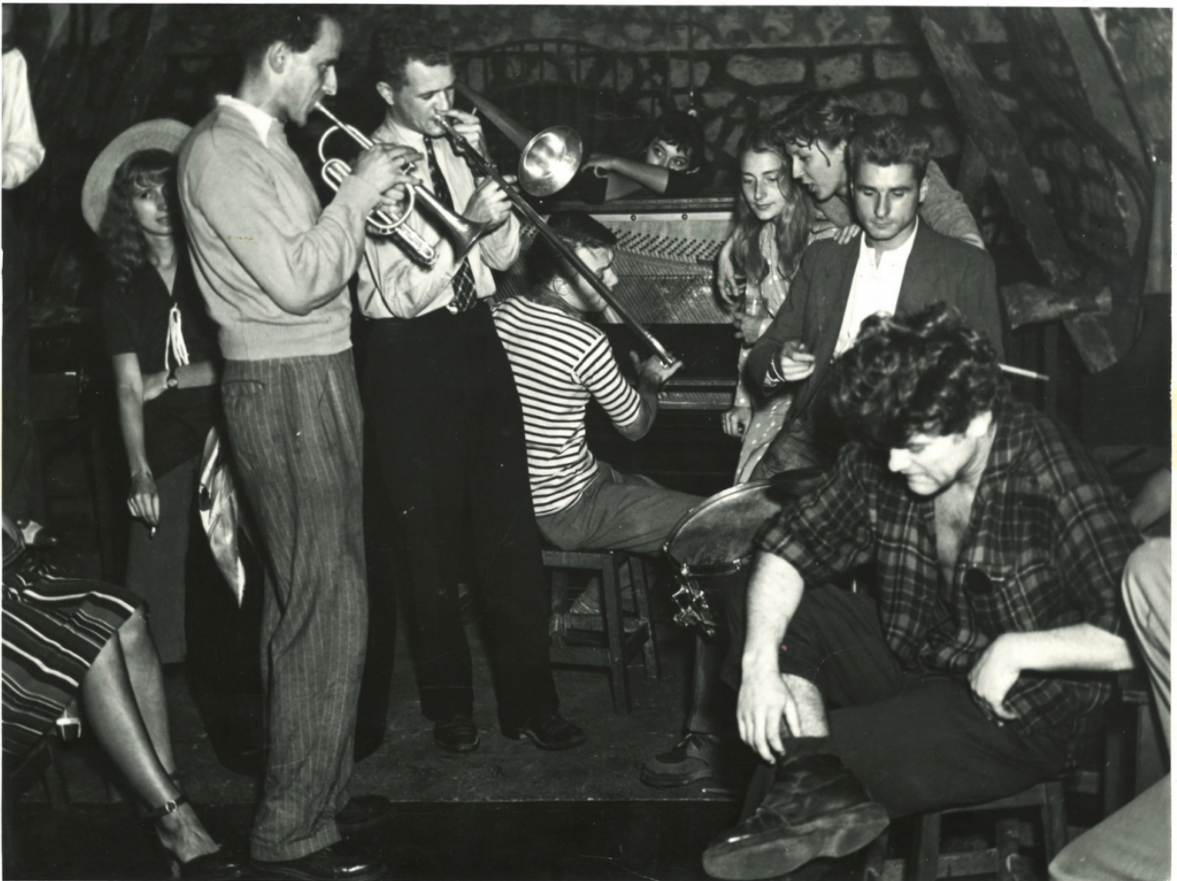
Борис Виан играет в клубе Le Tabou, 1948 год

Любовно прозванный «принцем Сен-Жермен-де-Пре», он не просто сам играл на трубе, но и преподавал джаз, писал статьи в журнал Jazz Hot , став страстным пропагандистом этой культуры. Издатель и организатор концертов, он много сделал для того, чтобы имена и музыка Майлза Дэвиса, Чарли Паркера, Диззи Гиллеспи и Бикса Бейдербека оказались у французов на слуху, в буквальном смысле слова.