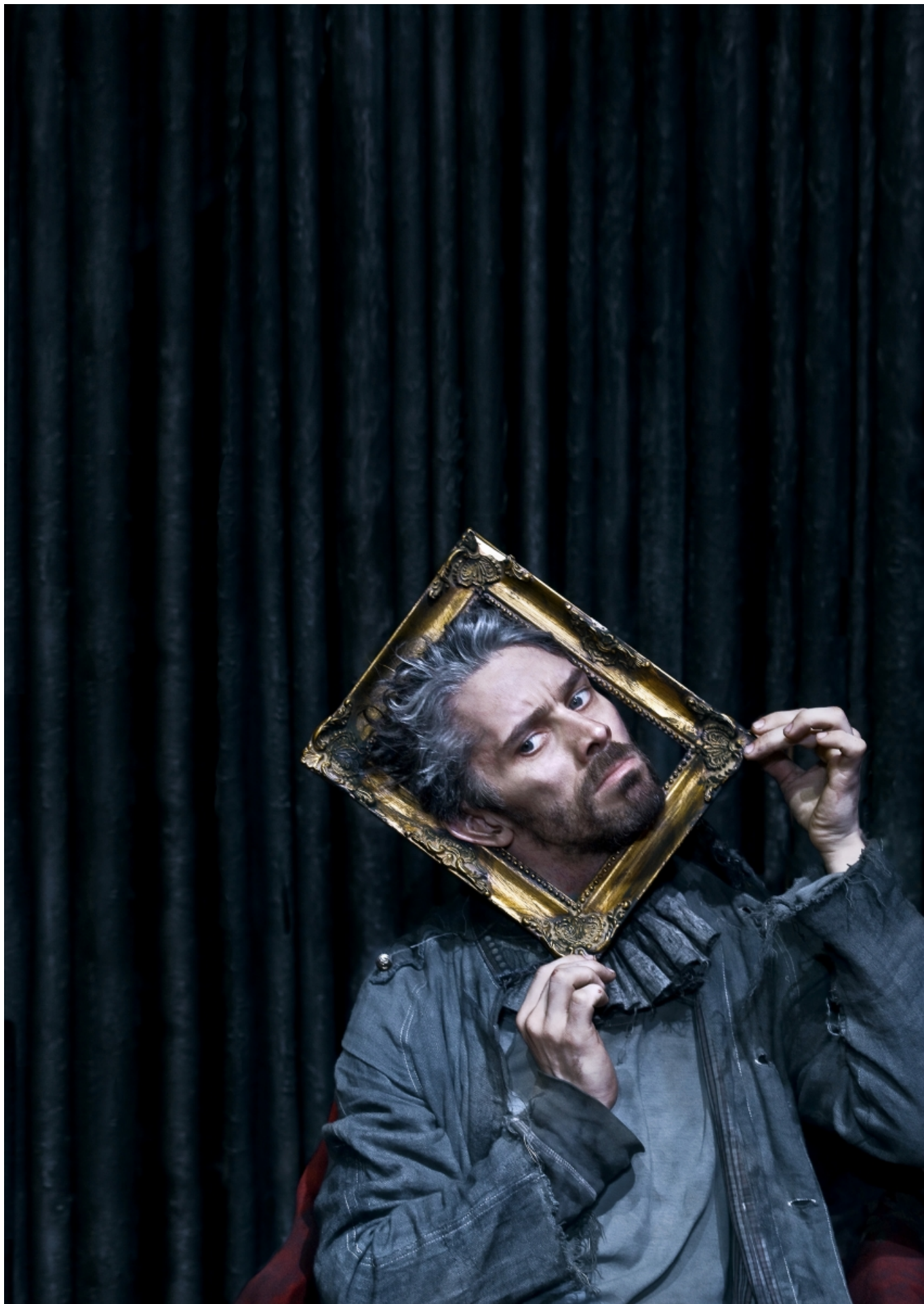
Сцена из спектакля "Рауль"