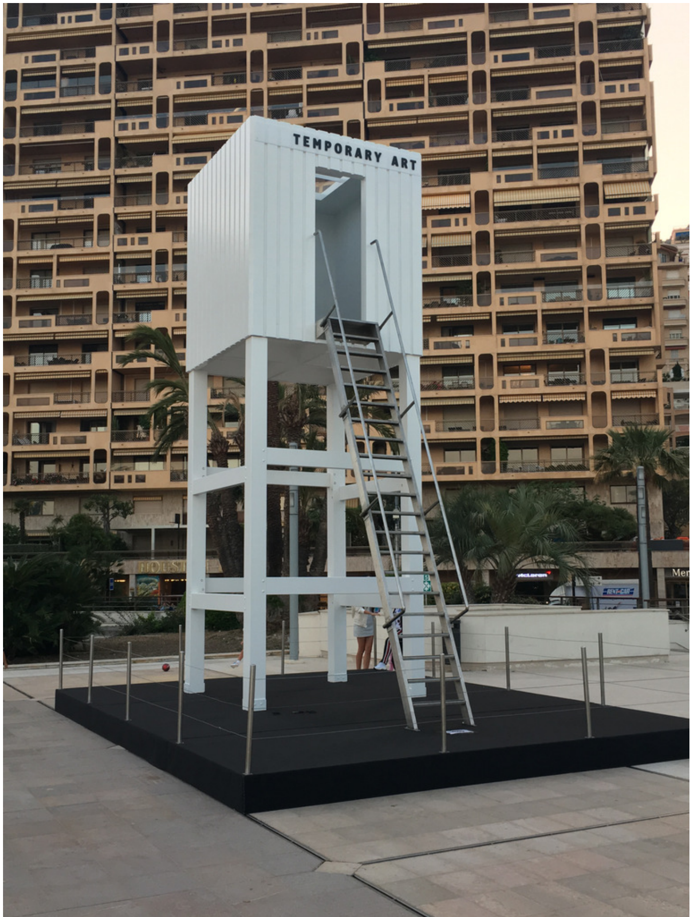
Temporary art - памятник преходящему искусству? (Nashagazeta.ch)

Если совсем коротко, то цель ярмарки – свести продавцов и покупателей в приятном,