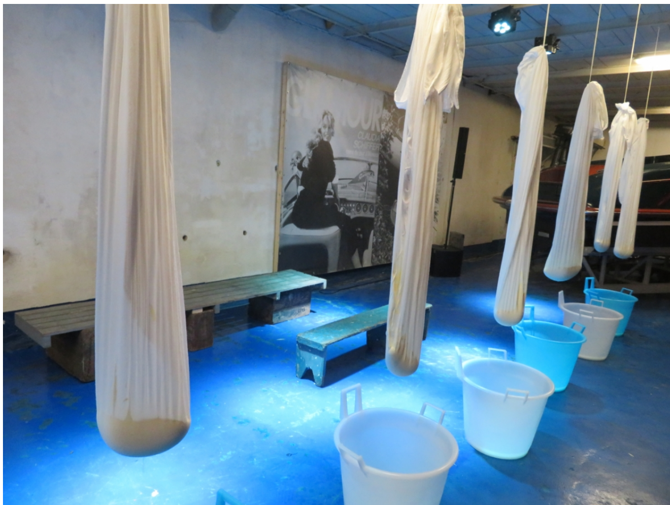
Моцарелла в зачатке как произведение искусства