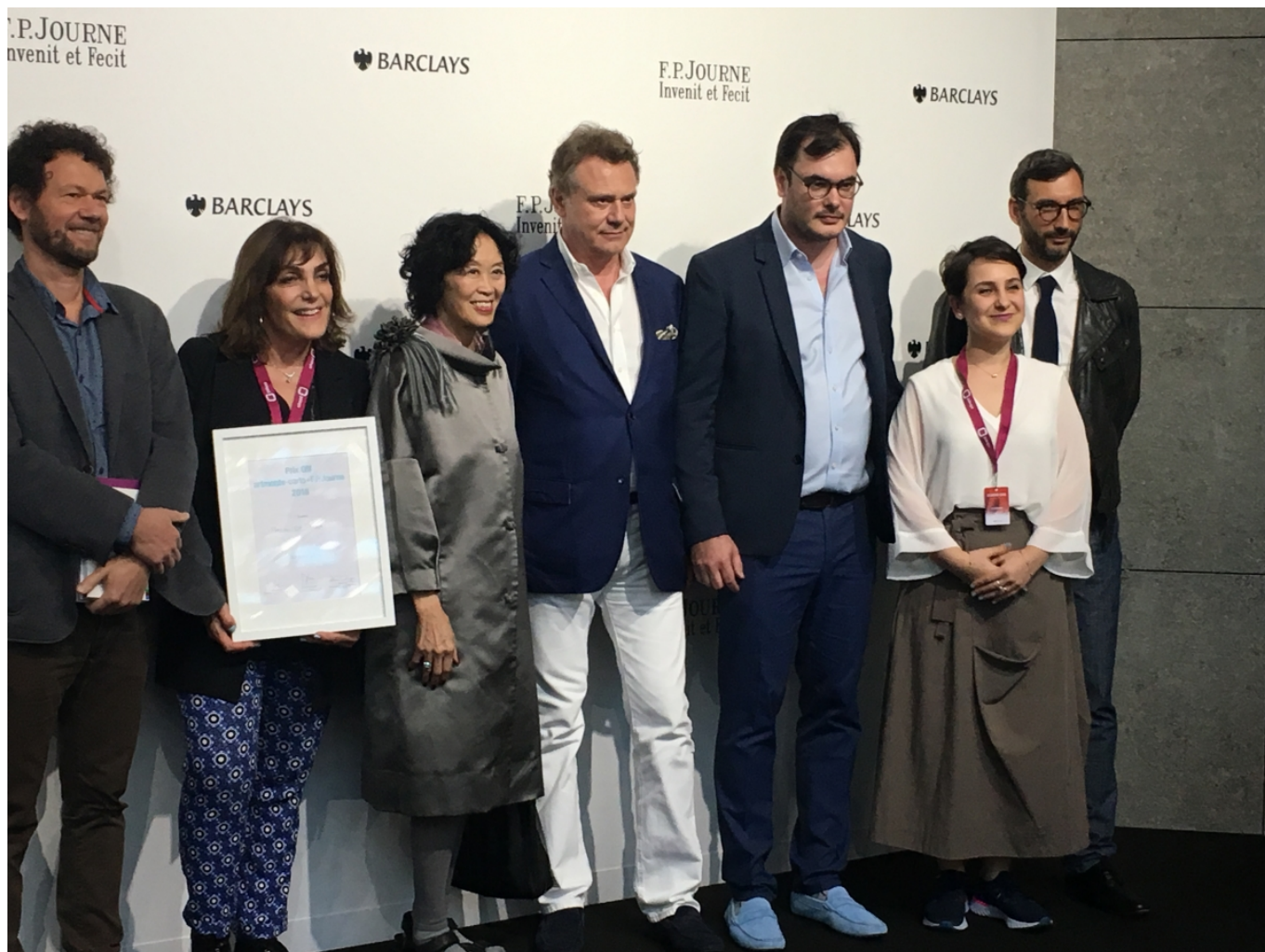
Премия Prix F. P. Journe вручена!