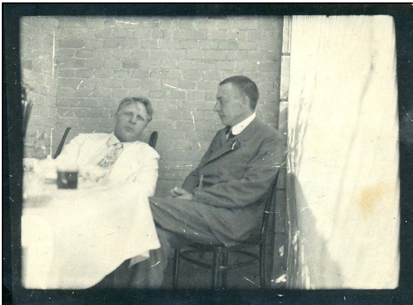
Ф. И. Шаляпин на даче у С. В. Рахманинова

Сергей Васильевич очень любил Швейцарию и в конце двадцатых годов задумал приобрести там дом, что и было осуществлено в начале тридцатых годов. Недалеко от Люцерна Рахманинов выстроил виллу, назвав ее «Сенар» ( по начальным буквам соего имени и имени жены, с прибавлением в конце начальной буквы своей фамилии). Он очень ее любил, нравилось бывать там и Шаляпину, который стал достаточно частым гостем у Рахманиновых. (О жизни С. В. Рахманинова Наша Газета уже рассказывала .)