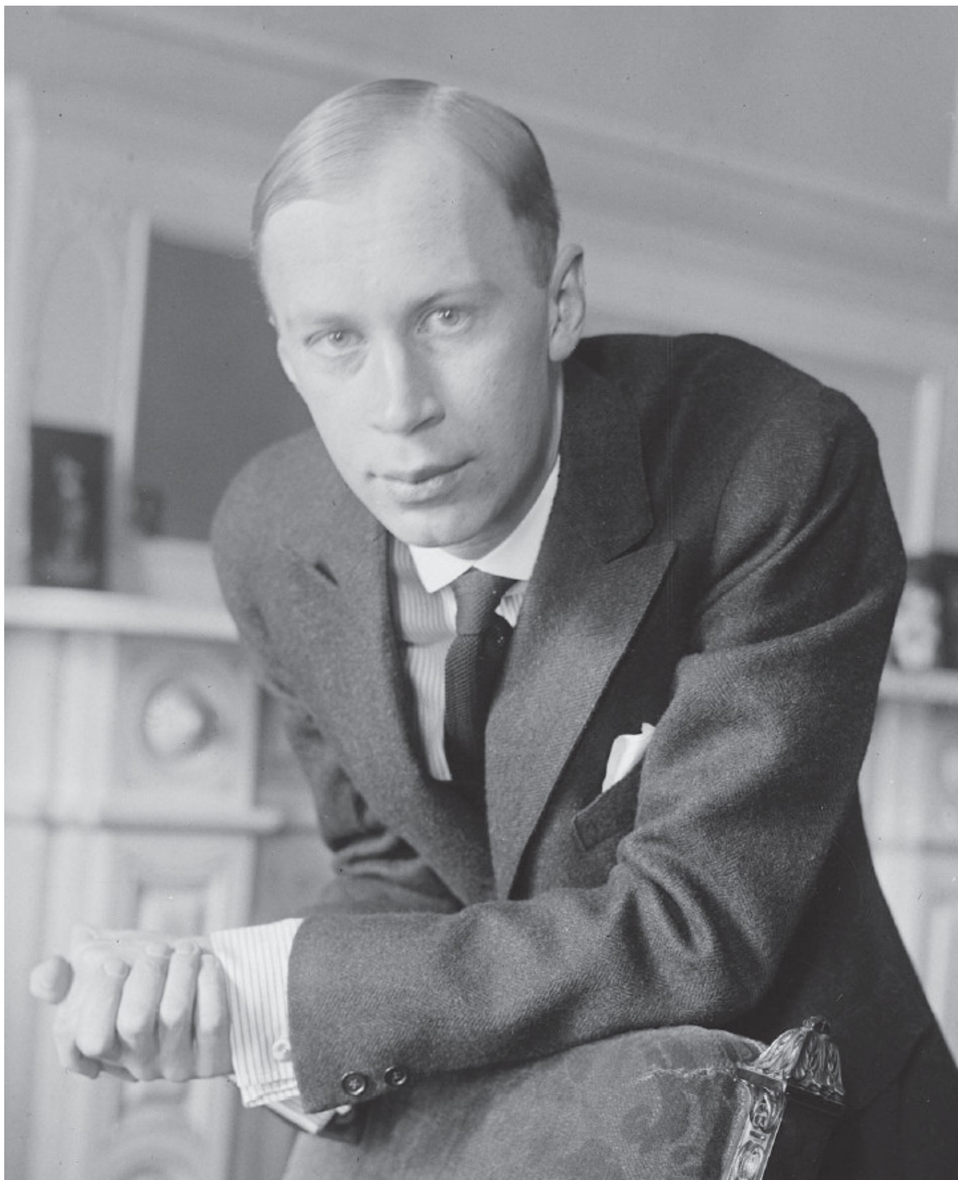
Сергей Прокофьев (1891-1953)

Второе отделение концерта откроет Серенада для духовых, виолончели и контрабаса Дворжака - чудесная, легкая для восприятия музыка, 24 минуты настоящего удовольствия.