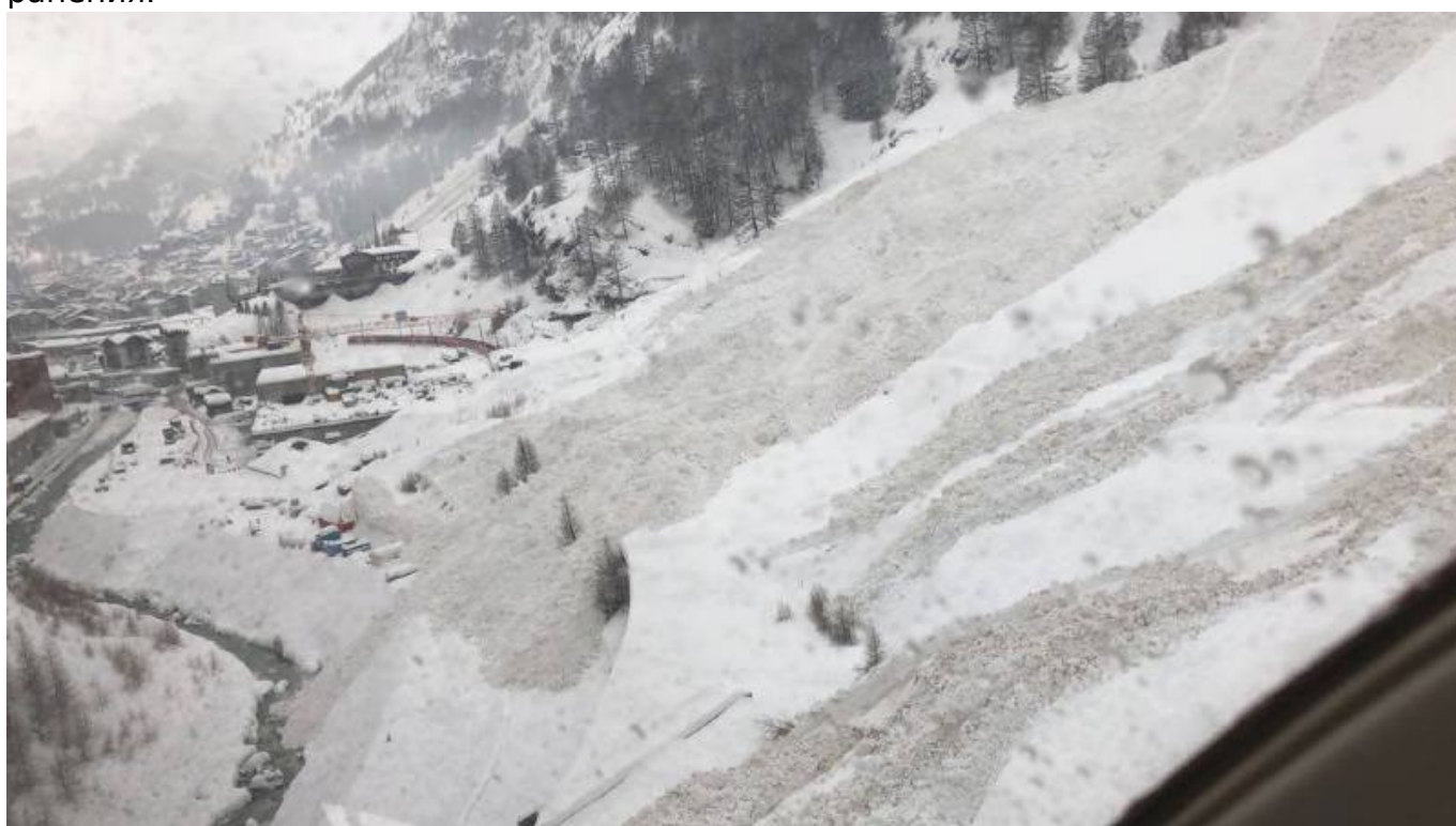
Вале во власти снега (lenouvelliste.ch)

В среду 3 января в Бернском Оберланде из-за сильных порывов ветра сошел с рельсов вагон компании Montreux-Oberland bernois: восемь человек получили ранения.