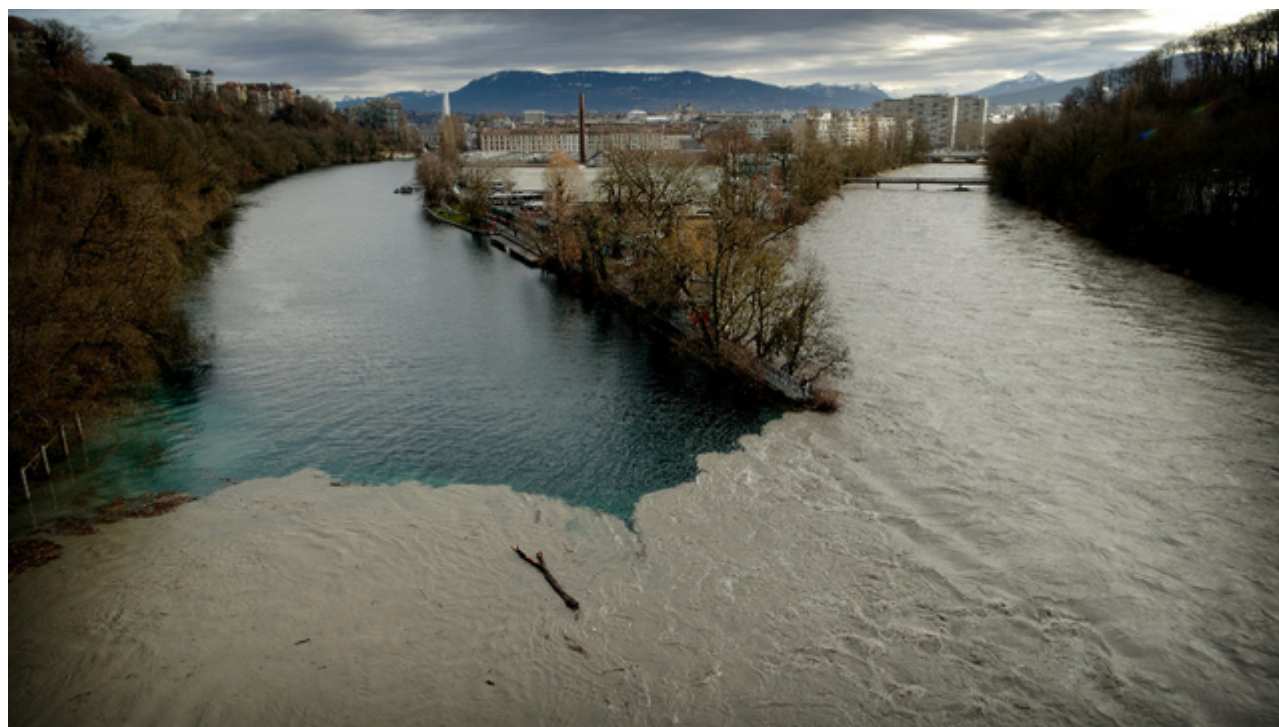
Женевская река Арва грозит выйти из берегов

Летом в валежанских Альпах здорово спрятаться от летней жары, а зимой – с ветерком скатиться со склонов и полюбоваться царством Снежной королевы. Правда, в последние годы зима не очень баловала валежанцев снегом. Зато в этом сезоне владельцы горнолыжных станций и туристы вздохнули спокойно: природа еще в декабре щедро рассыпала белое золото по склонам. Но за красивыми снегопадами последовали погодные неприятности: швейцарцы подсчитывают убытки, причиненные стихией за последнюю неделю.