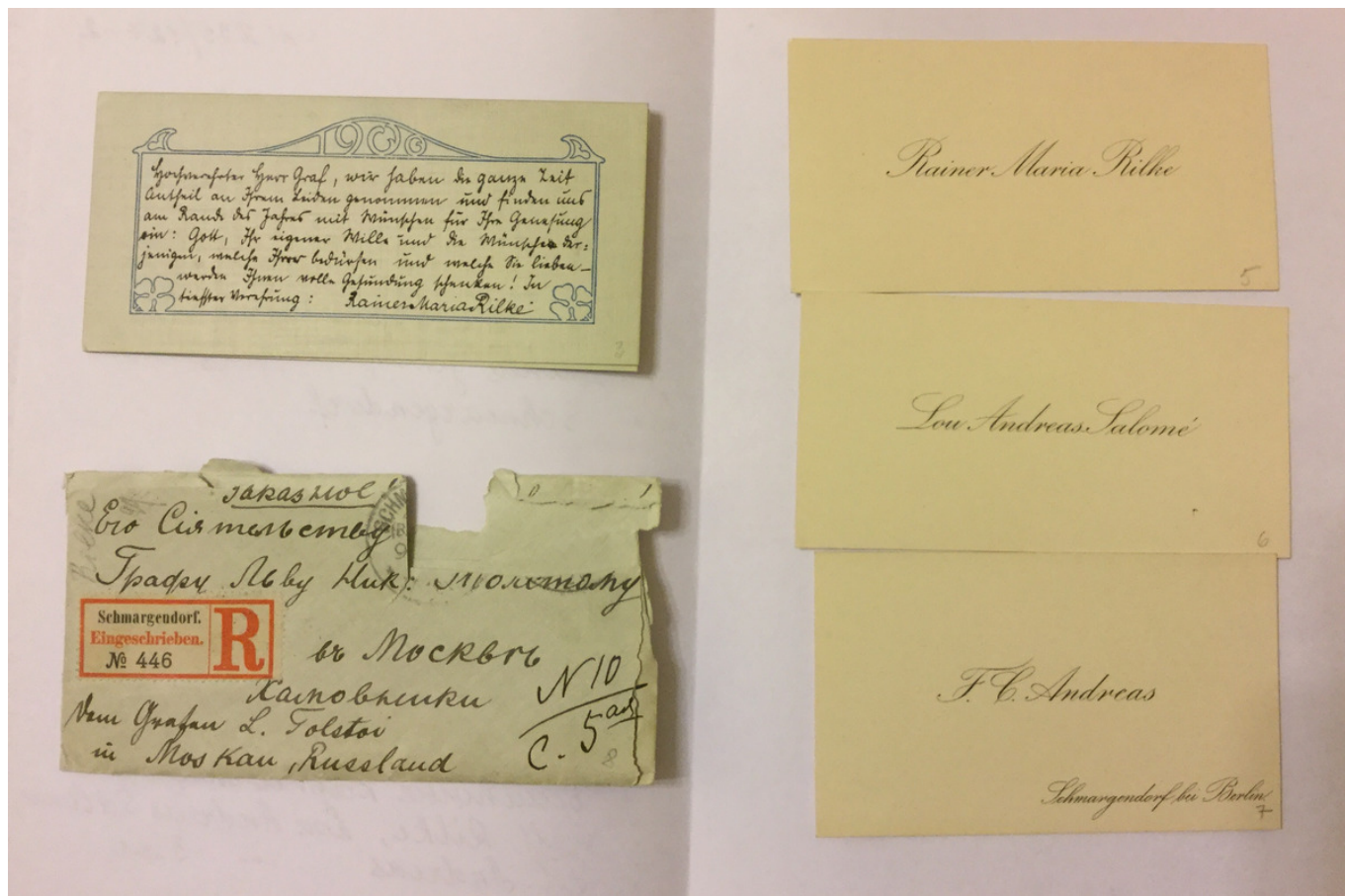
Письмо Райнера Марии Рильке Л. Н. Толстому и визитные карточки

Отдельный тематический блок экспозиции посвящен восприятию Рильке в СССР и России. «Значение Рильке для русской культуры до 1917 года, на мой взгляд, не следует переоценивать. Рильке знали, читали и переводили – но его творчество было достоянием узкого круга образованных людей. Стихотворные переводы Александра Биска и роман «Заметки Мальте Лауридс Бригге» в переводе Л. Горбуновой (Лепешкиной) – главные достижения дореволюционного периода», – считает Константин Маркович Азадовский, германист, публицист, переводчик, посвятивший изучению связи между Рильке и Россией большую часть своей профессиональной жизни.