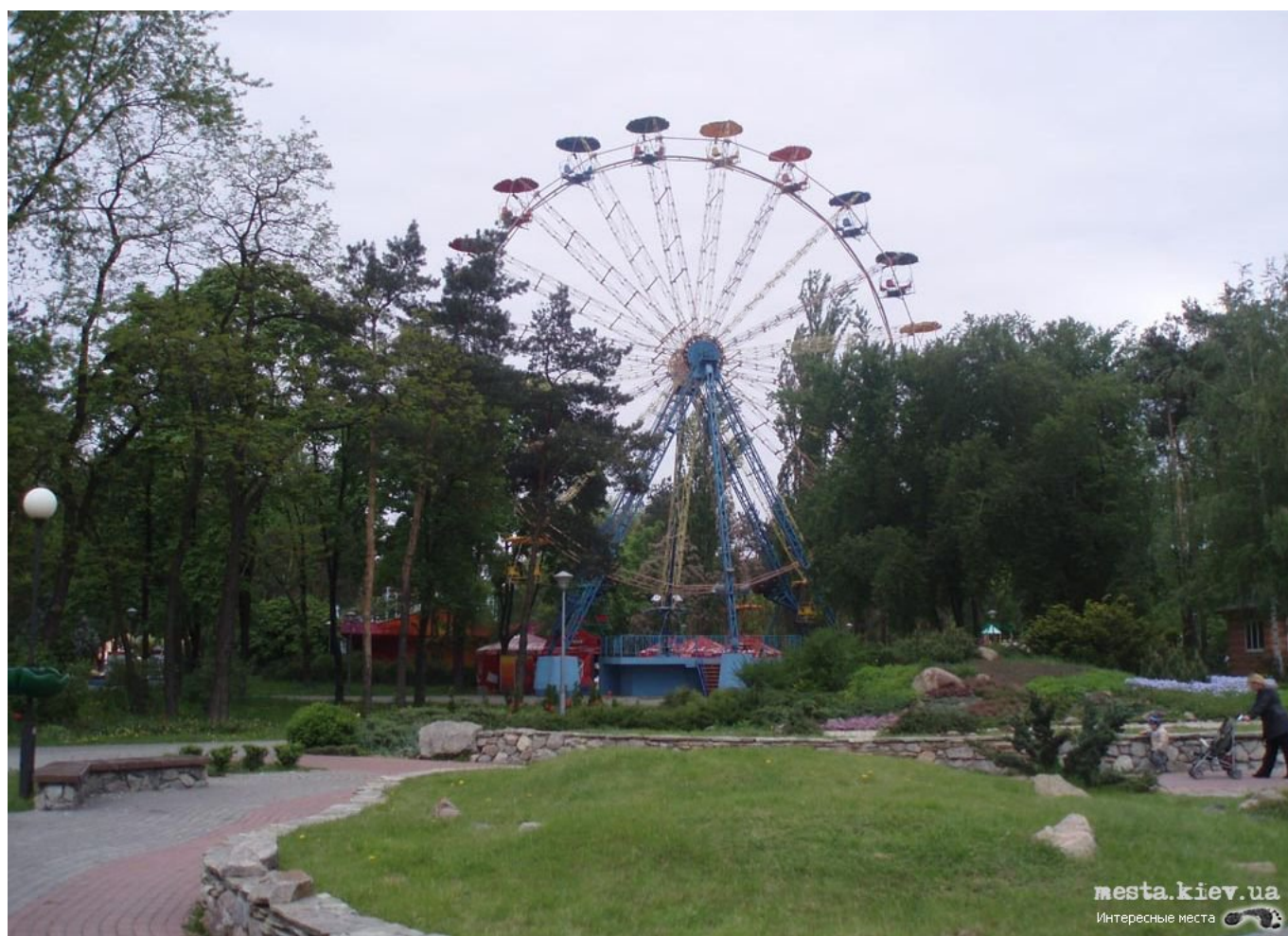
Уголок киевского Парка Победы