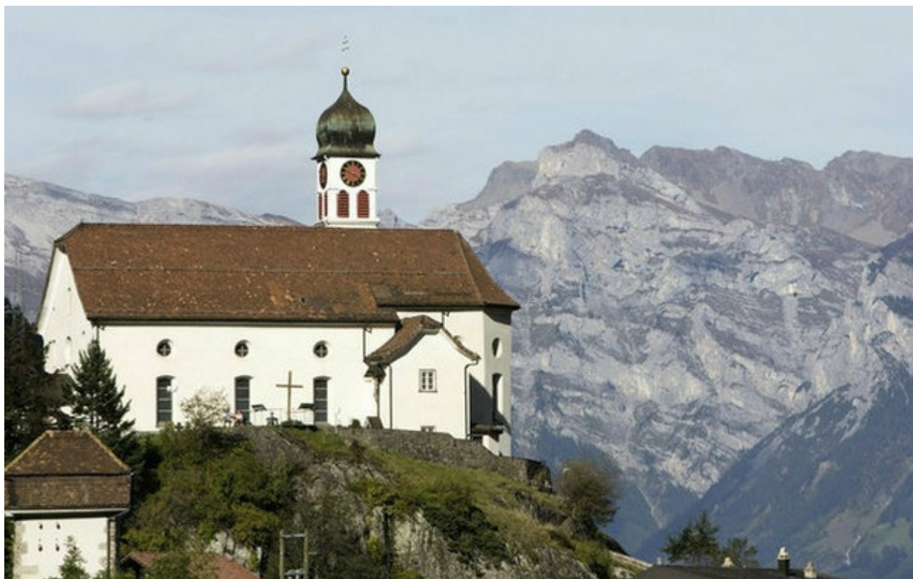
Церковь Вассен

километровый туннель», – пишет газета Le Matin. Внутри этой галереи, принявшей первые поезда еще в 1882 году, теперь можно лицезреть сцены из истории региона и мифы Сен-Готарда. Кстати, линия, состоящая из двух сотен мостов и семи винтообразных туннелей, привлекала путешественников всего мира с первого дня своего существования.