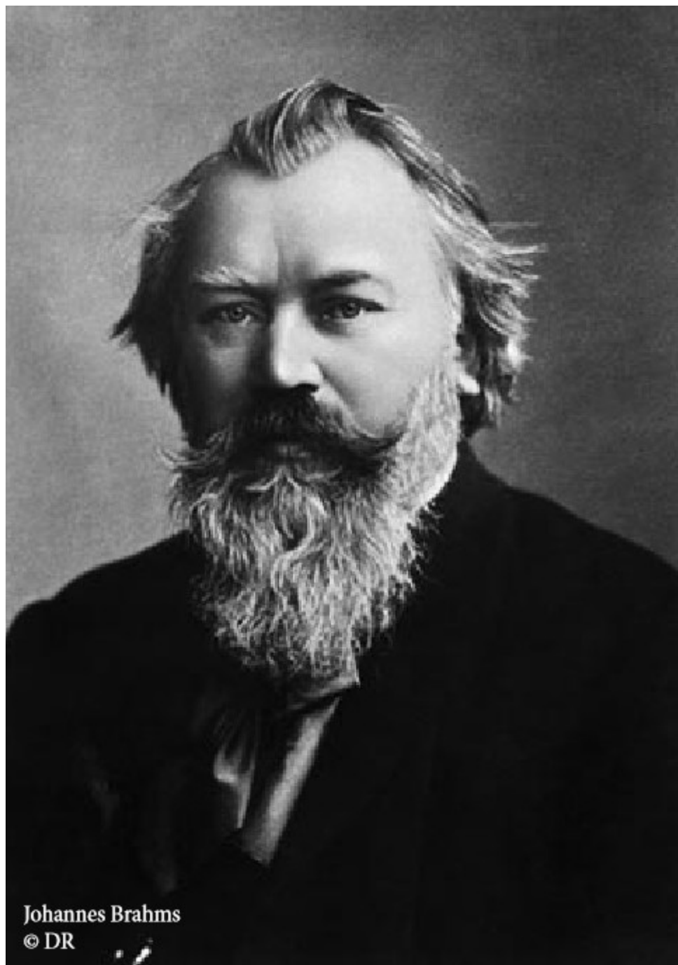
Иоганнес Брамс (1833-1897)

В 2009 году, блестяще дебютировав с Национальным молодежным оркестром Великобритании, он стал главным дирижером коллектива и оставался на этом посту до 2013 года. С Ливерпульским филармоническим и Национальным молодежным оркестром Великобритании дирижер неоднократно участвовал в фестивале BBC Proms. С сезона 2013/14 Петренко занимает должность главного дирижера Филармонического оркестра Осло (Норвегия).