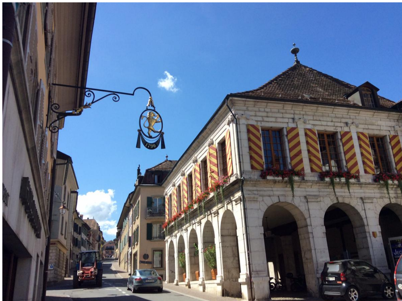
Обонн

Путешествовать Тавернье начал еще подростком, выезжал из Парижа по торговым надобностям, к шестнадцати годам отметился во многих европейских странах, а затем поступил на службу к имперскому наместнику Венгрии и будто бы присутствовал при сражениях против турок. Впоследствии Жан-Батист перешел на службу к мантуанским герцогам Гонзага, но Европа Европой, а греза – грезой. Тавернье мечтал увидеть Восток. В 1630 году 25-летний торговец нашел подходящих спутников-миссионеров, и поплыли они к турецким берегам. Константинополь, Эрзрум, Баку, Исфаган, Багдад, Алеппо – такой была программа этого дерзкого тура, занявшего у Тавернье три года жизни. В 1633 году Жан-Батист вернулся в Париж, привезя с собой роскошные ткани и драгоценные камни, и вскоре после этого, как считается, поступил в распоряжение Гастона Орлеанского. Времена стояли те самые, мушкетерские, воспетые Александром Дюма! Но дома нашему герою не сиделось – он заболел Востоком всерьез и надолго.