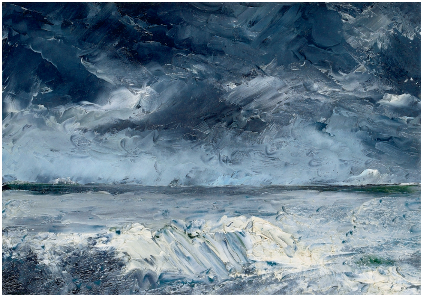
Август Стринберг. Лед на побережье, 1892. Частная коллекция

Auteur: Надежда Сикорская, Лозанна , 14.10.2016.