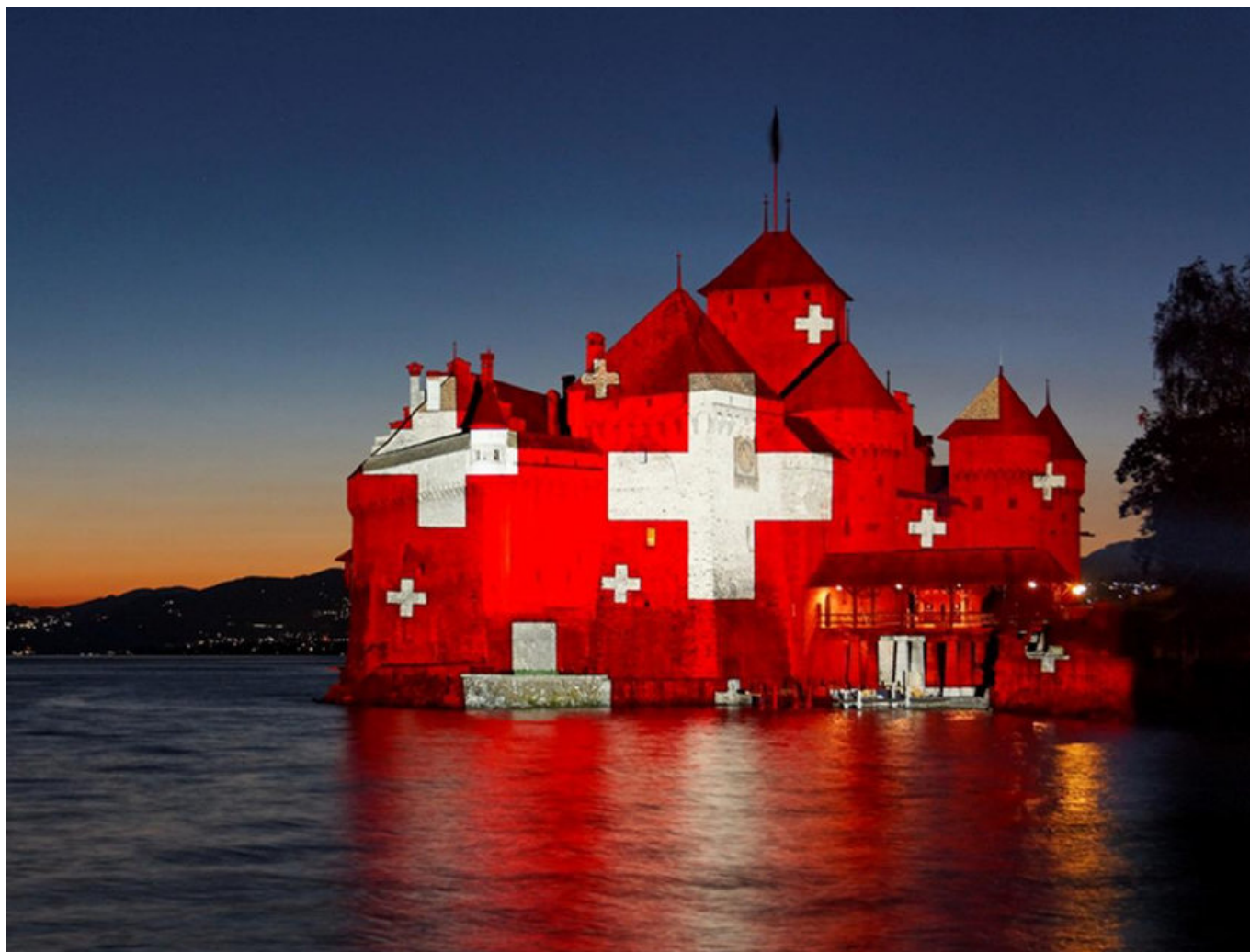
Праздник белого креста на красном полотнище

Auteur: Лейла Бабаева, Берн-Лозанна-Женева-Монтре-Веве , 01.08.2016.