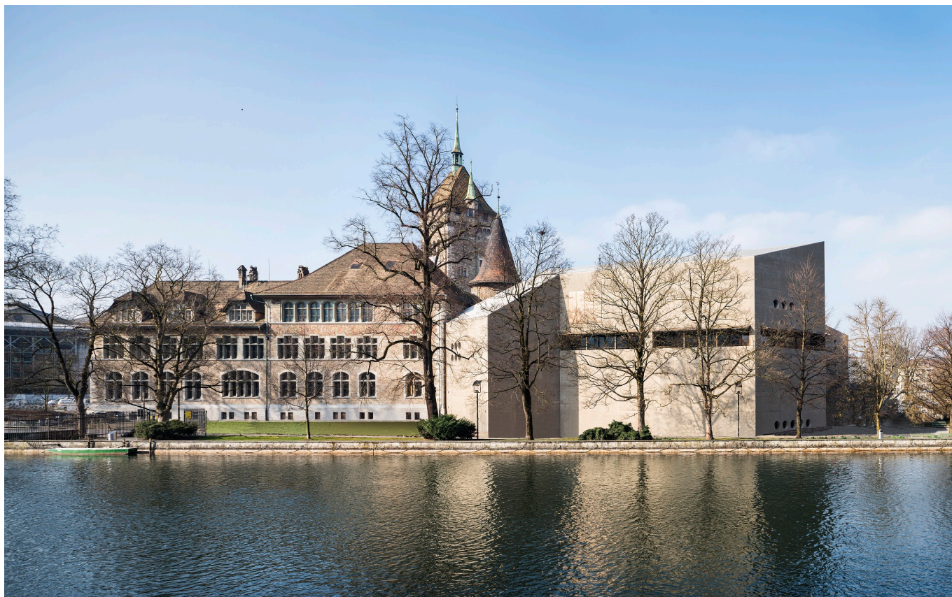
Старое и новое здания Национального музея Швейцарии

Auteur: Надежда Сикорская, Цюрих , 01.08.2016.