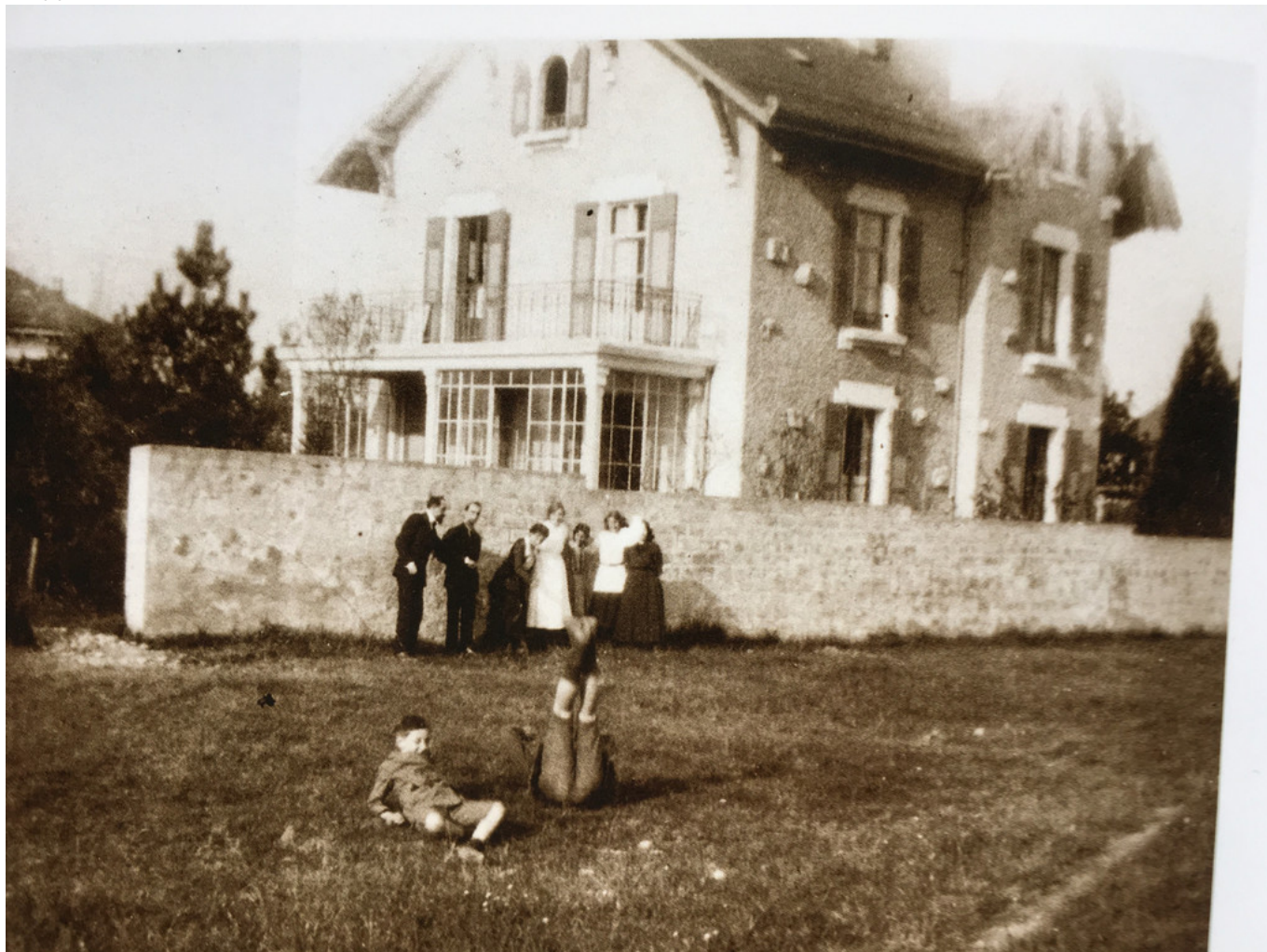
Villa des Saules в Коппе

оппонентов и подогреть. В итоге первым запертым в быке оказался сам его изобретатель – Перилл. Надо согласиться жить в чреве быка, ведь только там мысль становится реальной, потому что она – огненная, говорит нам Шестов. Шестов, обожавший, естественно, Ницше, заявлявшего, что имеют смысл только те идеи, за которые их автор готов умереть. Философия – занятие не для всех, не просто знание, способствующее развитию, как хотел убедить Гегель. Она имеет смысл лишь в чреве медного быка.