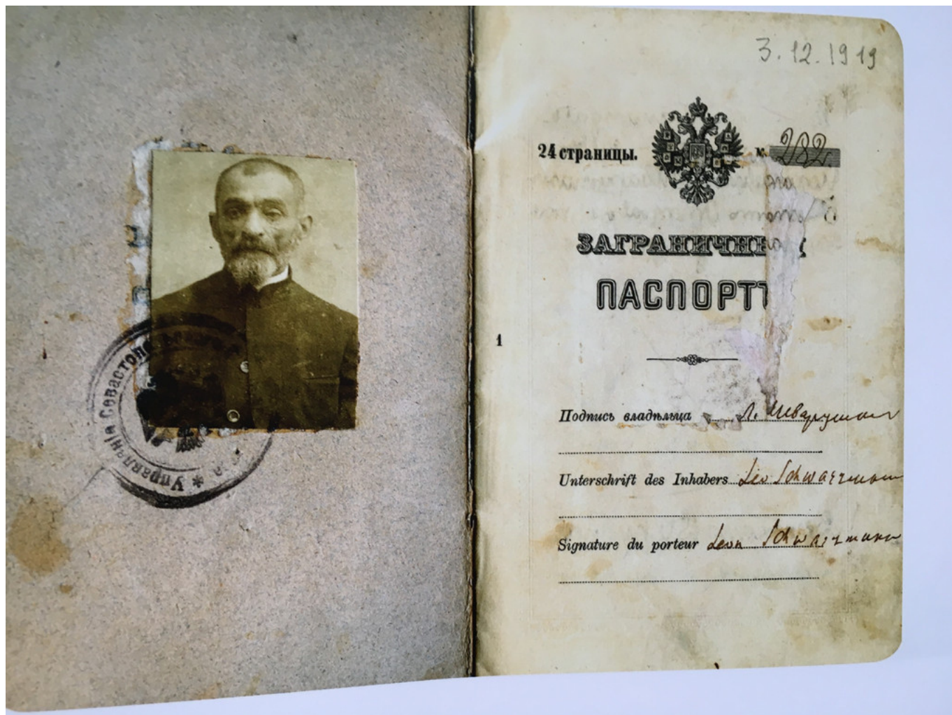
Заграничный паспорт Льва Шестова (Шварцмана)