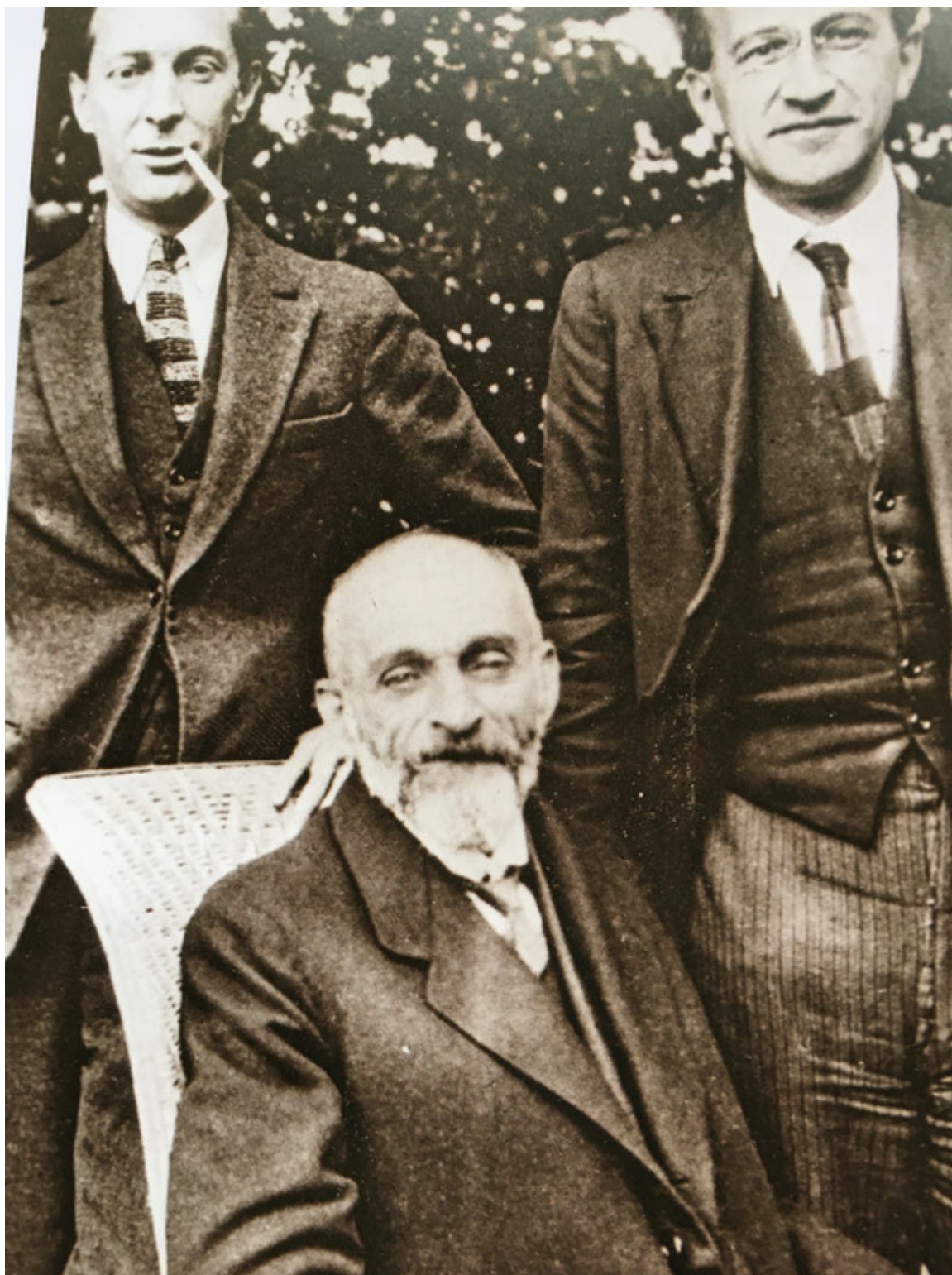
Лев Шестов в Понтины между Жаком Шифриным, создателем "Плеялы" и Борисом де Шлоцером. 1923 г.

Шестов, 150-летие которого мы сейчас отмечаем, остается молодым автором. Он вызывает на бой любые устоявшиеся идеи, независимо от возраста и эпохи противника. В этом смысле он омолаживает мир. В эти дни в мэрии 6-го парижского округа проходит изумительная выставка, которая останется в памяти благодаря прекрасному сопровождающему ее каталогу. Выставка организована Рамоной Фотиад, которая потихоньку переиздает все значительные тексты Шестова, переведенные в свое время Борисом де Шлоцером. Благодаря ее усилиям стали доступны написанная в Коппе книга «На весах Иова», с блестящим комментарием