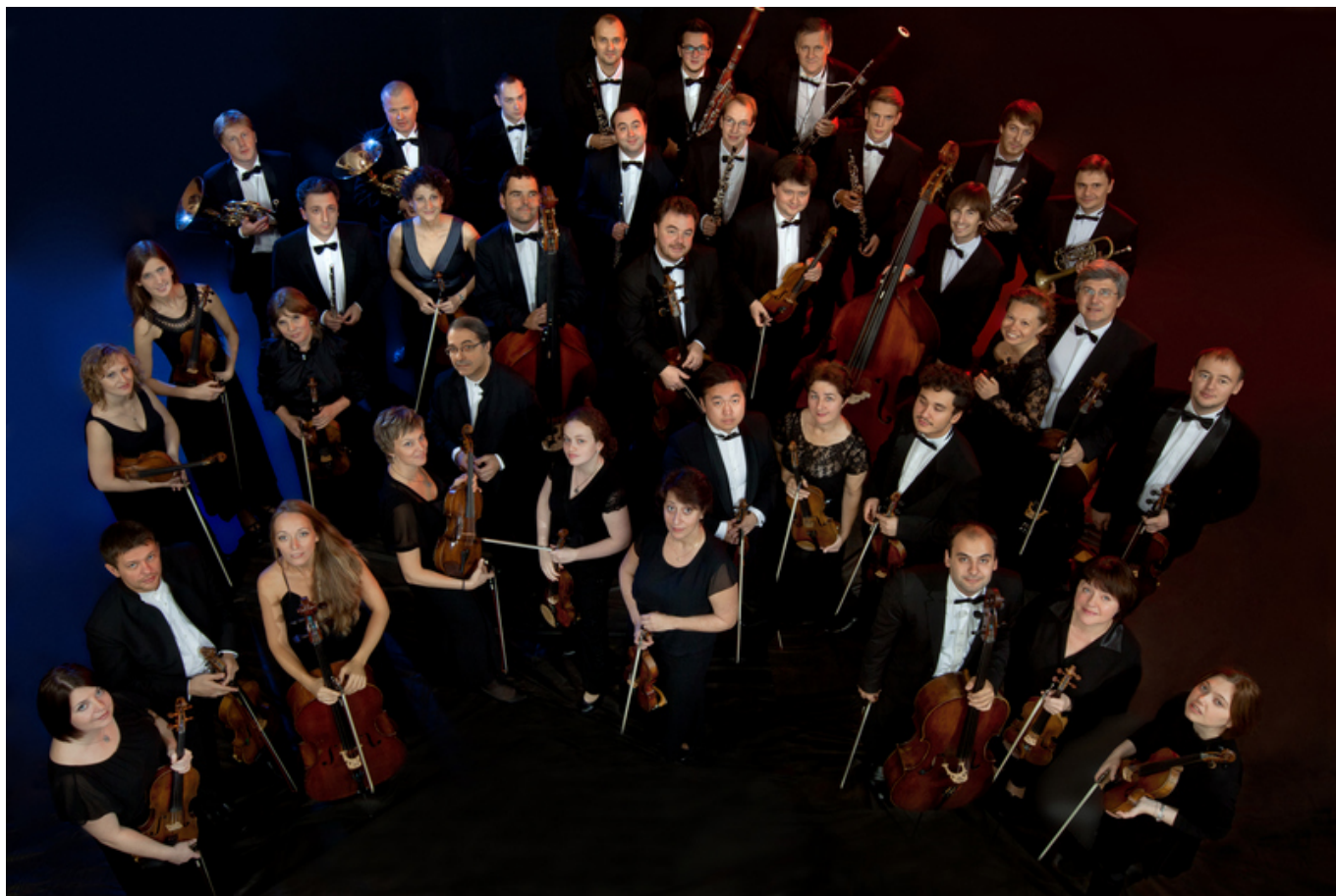
Камерный оркестр Musica Viva

14 апреля в московском Концертном зале имени П.И. Чайковского в исполнении камерного оркестра Musica Viva под руководством Александра Рудина и международного состава солистов прозвучат не исполнявшиеся ранее в России произведения Генделя и Хассе. Наша Газета.ch выступила информационным партнером этого проекта, реализуемого при поддержке Посольства Швейцарии в Москве.