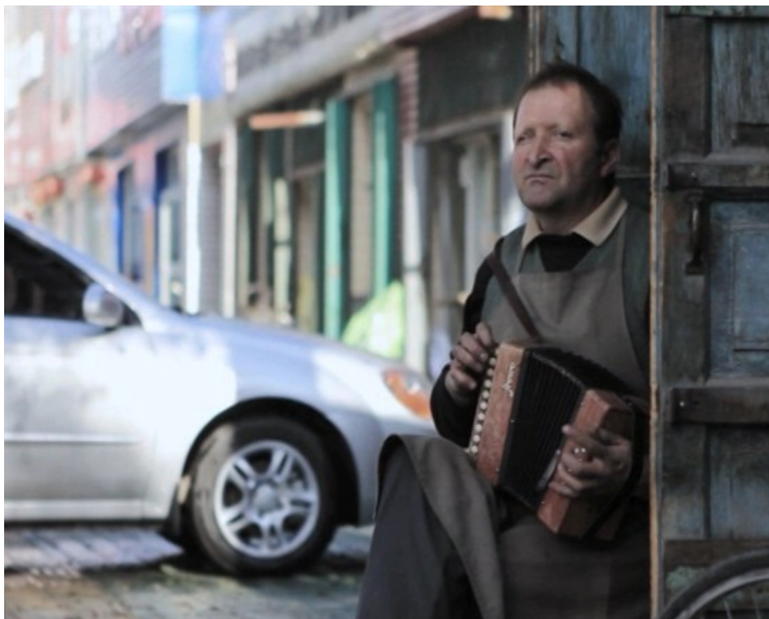
"Кадриль над Тянь-Шанем" (Россия, 2012)