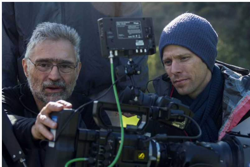
На съемках фильма

фильма (1 час 32 минуты), выбор логично пал на него. В названии отображена история монастыря: он основан на крови мученика Маврикия и его воинов. Из их крови (франц. «sang») процвел, окреп (франц. «sève») центр духовности, образования и искусства. Конечно, за пятнадцать веков существования аббатства монахи познали не только дни благоденствия, но и страданий, и разорения: не раз аббатство горело, подвергалось расхищениям, набегам, притеснениям со стороны сторонников реформаторства в XVI веке и революционеров двумя столетиями позднее. Современные насельники монастыря и те удивляются живучести своей обители: ведь с VI века здесь ни разу не прерывалась молитва.