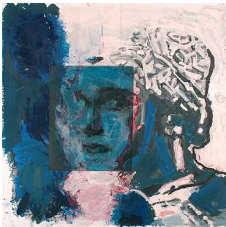
Российский хореограф и танцовщик Вацлав Нижинский, портрет работы Роже Пфунда, акватинта, 2005 ( rogerpfund.ch )

В интервью Музею искусства и истории он сказал о себе так: «Живопись дает мне