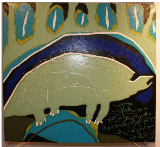
"Песня весенней черепахи"

есть внутренняя жизнь. Раньше модно было быть крутым, потом стало модно быть корректным и невозмутимым. Но ведь жизнь коротка, в ней важны внутренние достижения, то, что мы успели пережить в собственной душе.