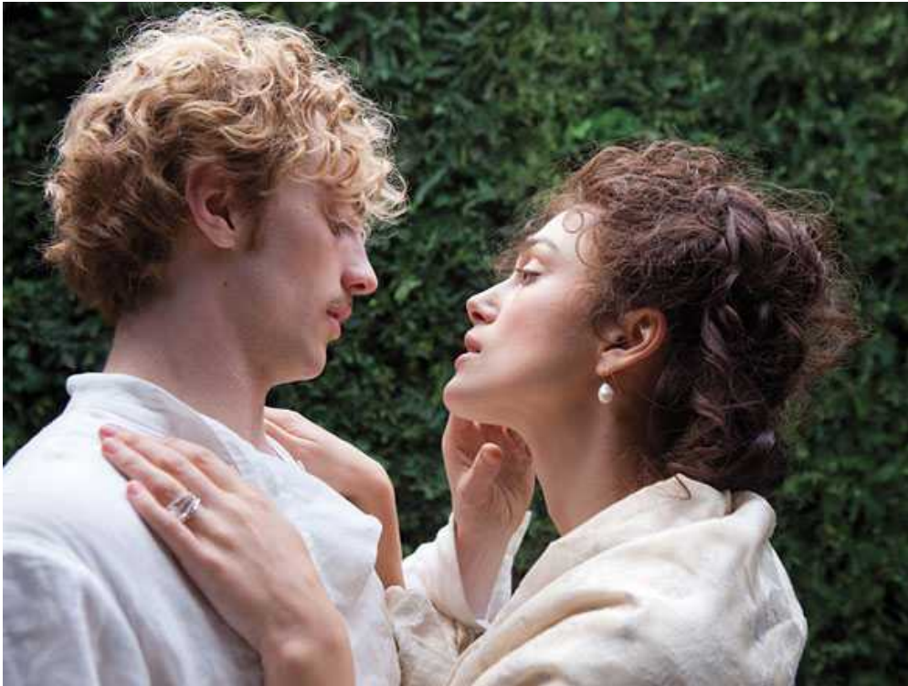
Вронский (Аарон Тэйлор-Джонсон) и Анна (Кира Найтли)

При этом зритель очарован игрой Киры Найтли, воплощающей Анну, которую убивает страсть: то трогательную и располагающую к себе, то невыносимую, капризную, нервную, съедаемую ревностью. С другой стороны Джуд Лоу – бородатый, постаревший и подурневший – талантливо влез в шкуру обманутого мужа, занудного и скованного Каренина, безумно страдающего, но предъявляющего своей жене ультиматум ради сохранения социального статуса.