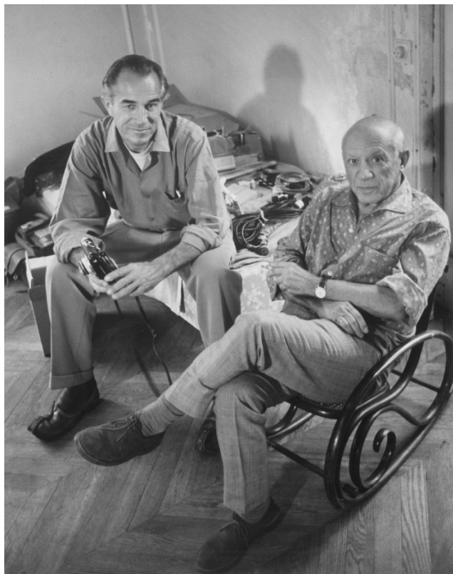
Дункан и Пикассо

Весь следующий год Дункан проведет вместе с художником, без ограничений фотографируя его самого, семью и, конечно, картины. Результатом такого необычного эксперимента станет вышедшая в 1958 году книга «Личная жизнь Пабло Пикассо. Фотографии величайшего художника», изданная Harper & Brothers. Мир впервые увидел Пикассо в его естественной среде – за работой в ателье.