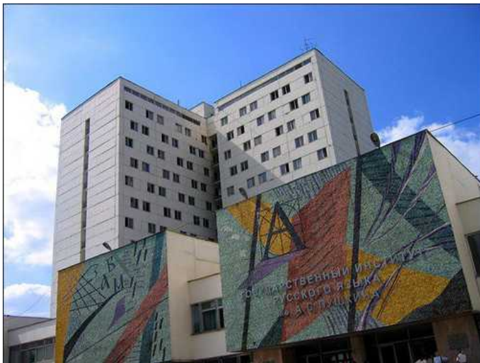
Институт русского языка имени Пушкина