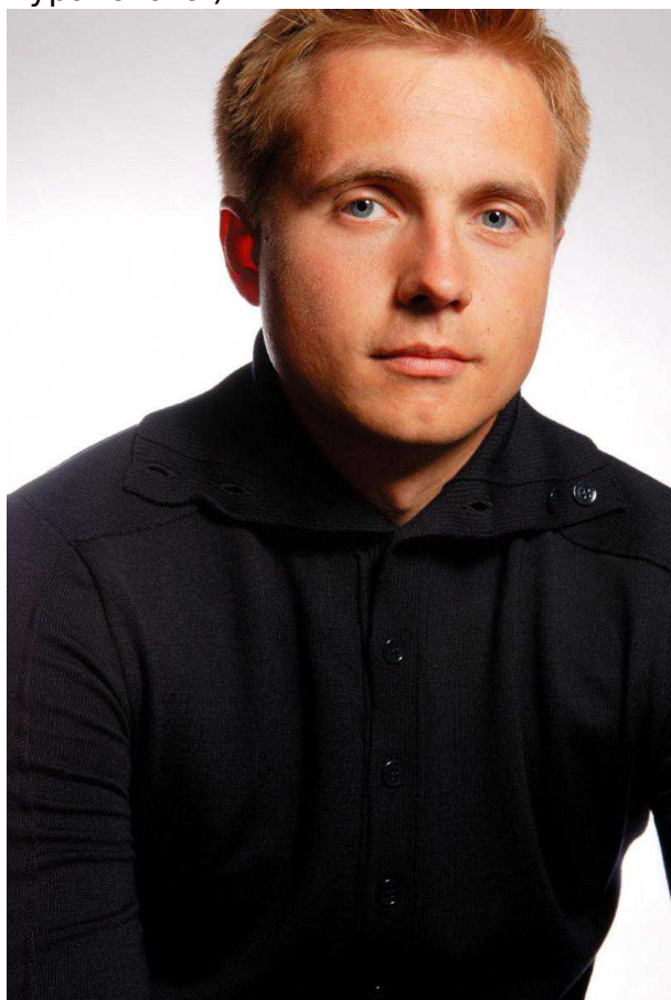
Василий Петренко