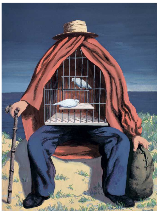
Рене Магритт. Терапевт.

Еще один швейцарский художник Феликс Валлотон, один из представителей группы Наби, хорошо известен во всем мире, и не станет открытием для любителей живописи. Его картины эмоционально и сюжетно контрастируют с работами Дега. На портрете женщины, выполненном в 1922 году, мы видим прикрывающую себя шалью женщину с сигаретой, которая с вызовом смотрит на зрителя.