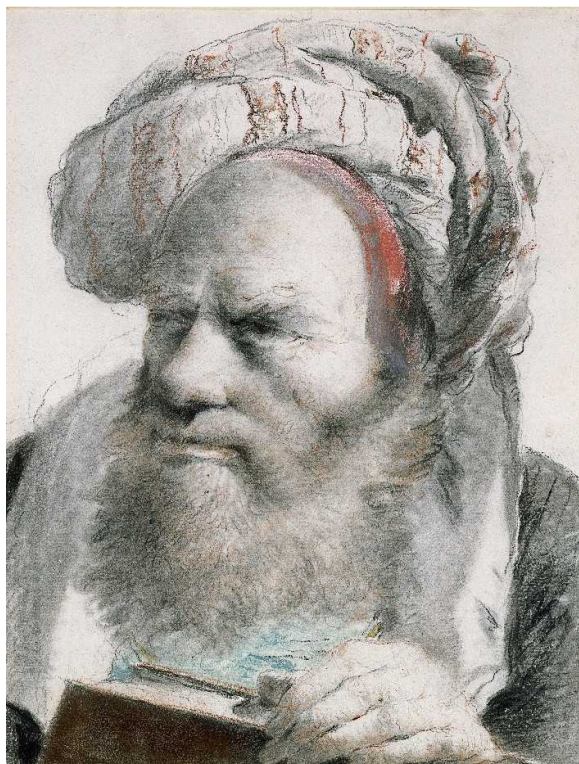
Лоренцо Тьеполо. Философ. ок.1770

Организирующим стержнем выставки является время: картины расположены в хронологическом порядке и посетители могут путешествовать из одной эпохи в другую, поднимаясь все выше и выше по винтовой лестнице. Но уже на первом этаже можно обратить внимание на объединяющие мотивы: сюжетно большая часть из них связана с Венецией. В зале художников Тьеполо, начать с которого нас приглашает название выставки, представлены рисунки коричневыми чернилами, тушью и карандашом работы трех венецианских мастеров из одной семьи: Джанбаттиста и двух его сыновей – Доменико и Лоренцо. Отец стал главным учителем для своих детей, которые не только сравнялись с ним в мастерстве, но и смогли развить его искусство. Джанбаттиста Тьеполо (1696-1770) часто изображал исторические и религиозные сюжеты, в то время как его старший сын Доменико (1727-1804) с тонкой иронией взялся за бытовые сцены из жизни венецианцев. Интересен своей наивностью и озорной улыбкой его Пульчинелла, один из персонажей комедии дель арте. Лоренцо (1736-1776), самого младшего в семье, отличает внимание к фигурам мыслителей и философов, которых он изображает погруженными в свои мысли, но при этом получившиеся образы поражают своей легкостью и даже некоторой воздушностью.