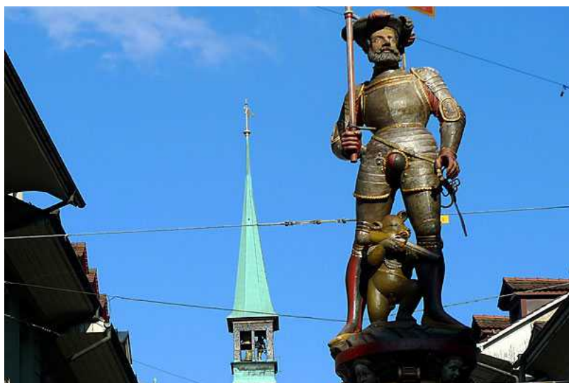
Медведь с мушкетом в Старом Городеерна

Всем известна пословица насчет «медвежьей услуги». В наши дни медведь представляется неуклюжим, агрессивным животным, способным блеснуть своим талантом разве что в цирке. В древности, когда человек, не изнеженный благами цивилизации, был способен гораздо более остро ощущать природу во всем ее многообразии, отношение к животным было иным. Из истории известны случаи трогательной дружбы человека с дикими животными, которые готовы были откликнуться на человеческое благородство отнюдь не «медвежьей услугой». Таковы были отношения египетского пустынного монаха первых веков христианства Герасима со львом, который служил святому старцу верой и правдой, а после его смерти – скончался, горюя на его могиле; преподобного Серафима Саровского с диким медведем, который приходил в его лесную келью и лакомился хлебом из рук русского старца; грузинского монаха Средневековья Шио Мгвинского, овечьи стада которого охранял спасенный им волк.