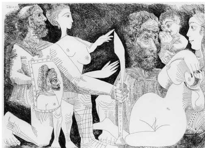
Пабло Пикассо, офорт 1968 года

100 гравюр, созданных с 1905 по 1971 годы, независимо от стилистических и философских исканий Пикассо в разные периоды жизни и творчества, объединены одной темой: желаемого и желавшего женского тела. Сексуальность становится центром притяжения в художественном универсуме мэтра, приобретая гротескные, чувственные, откровенные или символические формы.