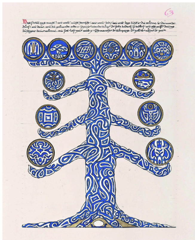
Мысль изреченная: пергаментные листы

Аккуратно сброшюрованные тетради стенограмм пересылаются немногим коллегам-психоаналитикам, чьим мнением Юнг особенно дорожит. Собирался ли он публиковать свои записи? Ответа на этот вопрос не существует. Мы знаем лишь, что в середине 1913-х Юнг начинает перерабатывать тексты, придавая им форму литературного повествования. Пытаясь передать нюансы и полутона, он распределяет роли между персонажами драм, невольным участником которых является. Вместо разрозненных конспектов появляется обтянутый красной кожей фолиант в тысячу пергаментных, с золотым обрезом, страниц. Юнг называет его Liber Novus, Новой Книгой, Новым Заветом аналитической эсхатологии.