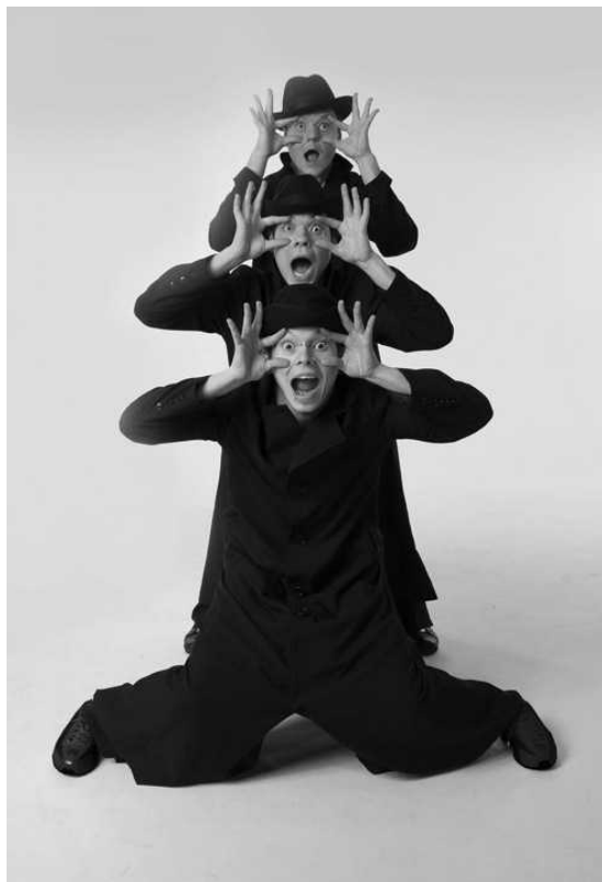
Трио Золотые звезды