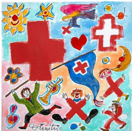
Веселый красный крест от знаменитого клоуна Димитрия

Самым ярким и популярным стало произведение настоящего художника, Ханса Эрни , который в прошлом году отмечал собственное столетие. Как всегда эмоционально подойдя к проекту, он поставил в центр изображения портрет Анри Дюнане. Цена работы Эрни поднялась пока что до почти 9 тысяч франков. За ним следует крест Далай-Ламы, он очень простой, но стоит уже больше 5 тысяч франков. Но, как и на любом аукционе, цены подскочат в последний момент.