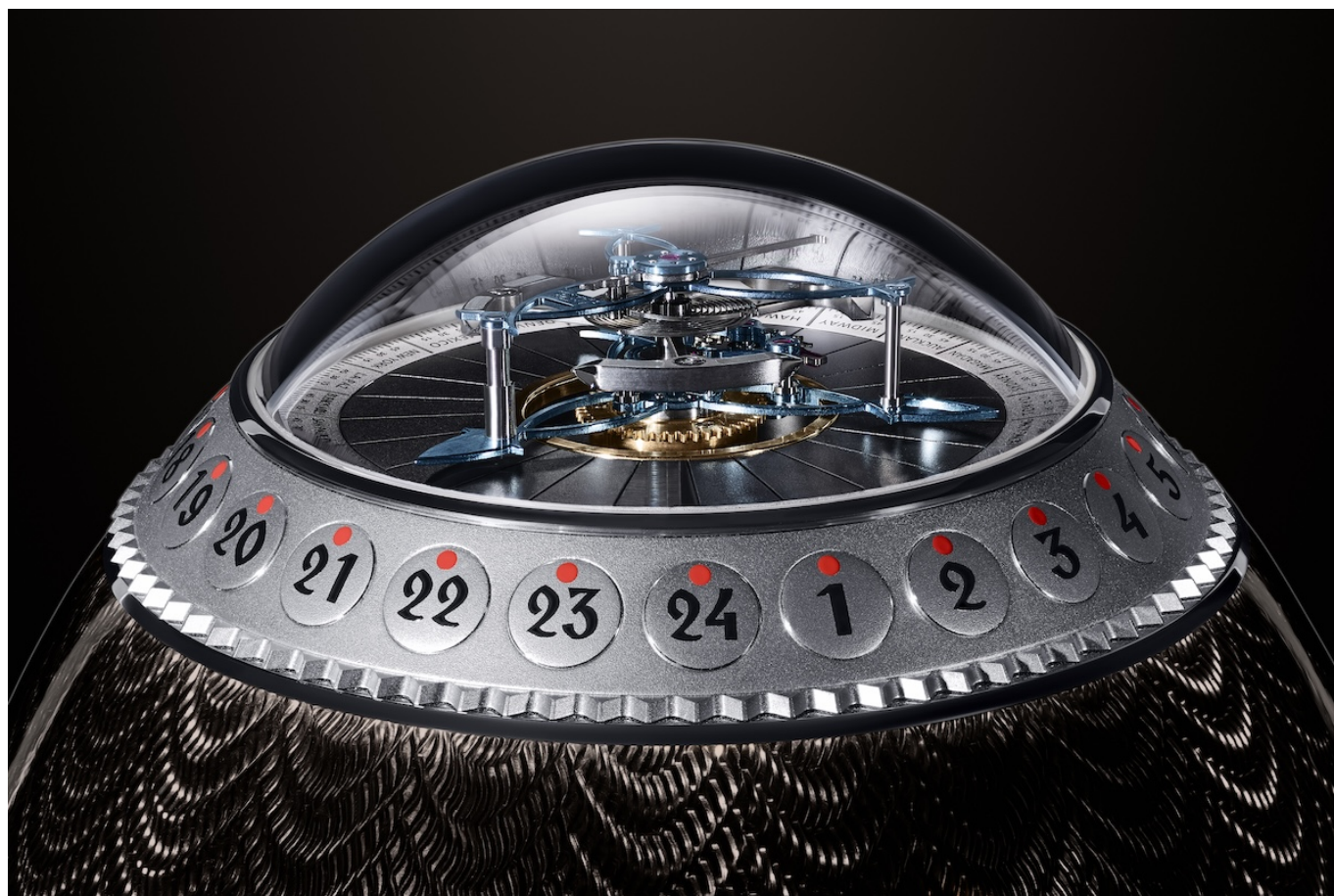
«Петербургский пасхальный турбийон».

контрасте с отделкой 23 других секторов диска.