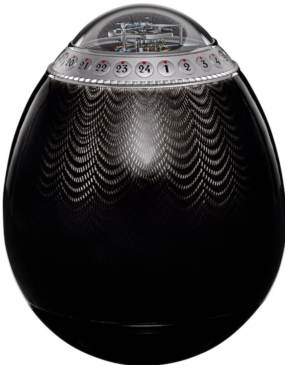
«Петербургский пасхальный турбийон».

Источником вдохновения для Антона Суханова послужили знаменитые пасхальные яйца Карла Фаберже. Но если изделия Фаберже отличались подчеркнутой декоративностью и орнаментальностью, что соответствовало вкусам той эпохи, то Суханов выбрал другой путь, сделав ставку на минимализм и современный дизайн. Часы имеют яйцевидную форму и удерживаются в вертикальном положении без каких-либо опорных деталей. Структура часов имеет три части: основание из отполированной до зеркального блеска нержавеющей стали, «скорлупу», т.е. основную часть из серебра с ручной гильошировкой и покрытием из полупрозрачной горячей эмали, а также купол из сапфирового стекла, под которым расположен турбийон и индикаторы времени. У купольного стекла находится ободок с насечками и отметками 24-часовой шкалы, которая также позволяет измерять секунды – турбийон совершает один оборот ровно за 24 секунды. При повороте ободка можно установить время одновременно на 24 часовых пояса. Сектор, указывающий время в Москве и Санкт-Петербурге, выделен радиальной шлифовкой, выделяющейся на