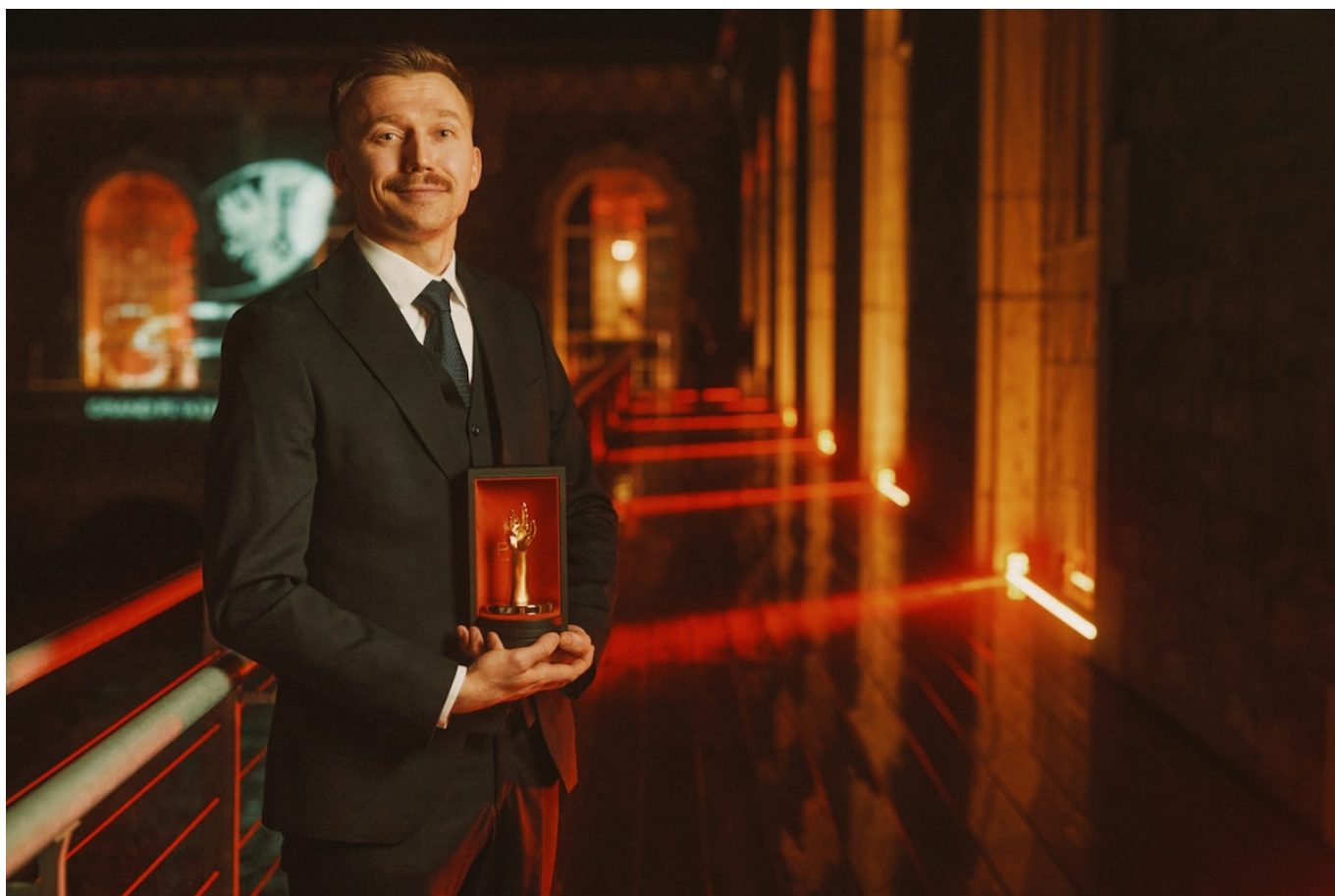
Антон Суханов.

Author: Заррина Салимова, Женева , 20.11.2025.