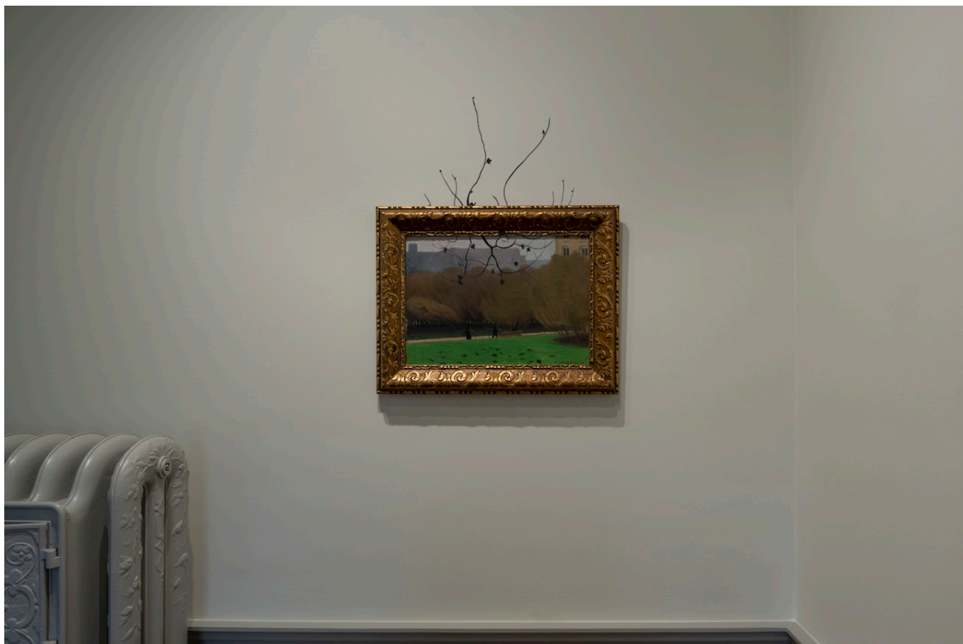
Недко Солаков. Быть Валлоттоном, 2025 г.

коллекции немало самых разных работ знаменитого швейцарца, куратор Конрад Биттерли пригласил к осмыслению его творчества живущего в Софии художника-концептуалиста. Солаков – не только самый известный современный болгарский художник в мире, участник Венецианской биеннале и Касселельской documenta , но и автор замечательно остроумных художественных историй, «читать» которые – отдельное удовольствие.