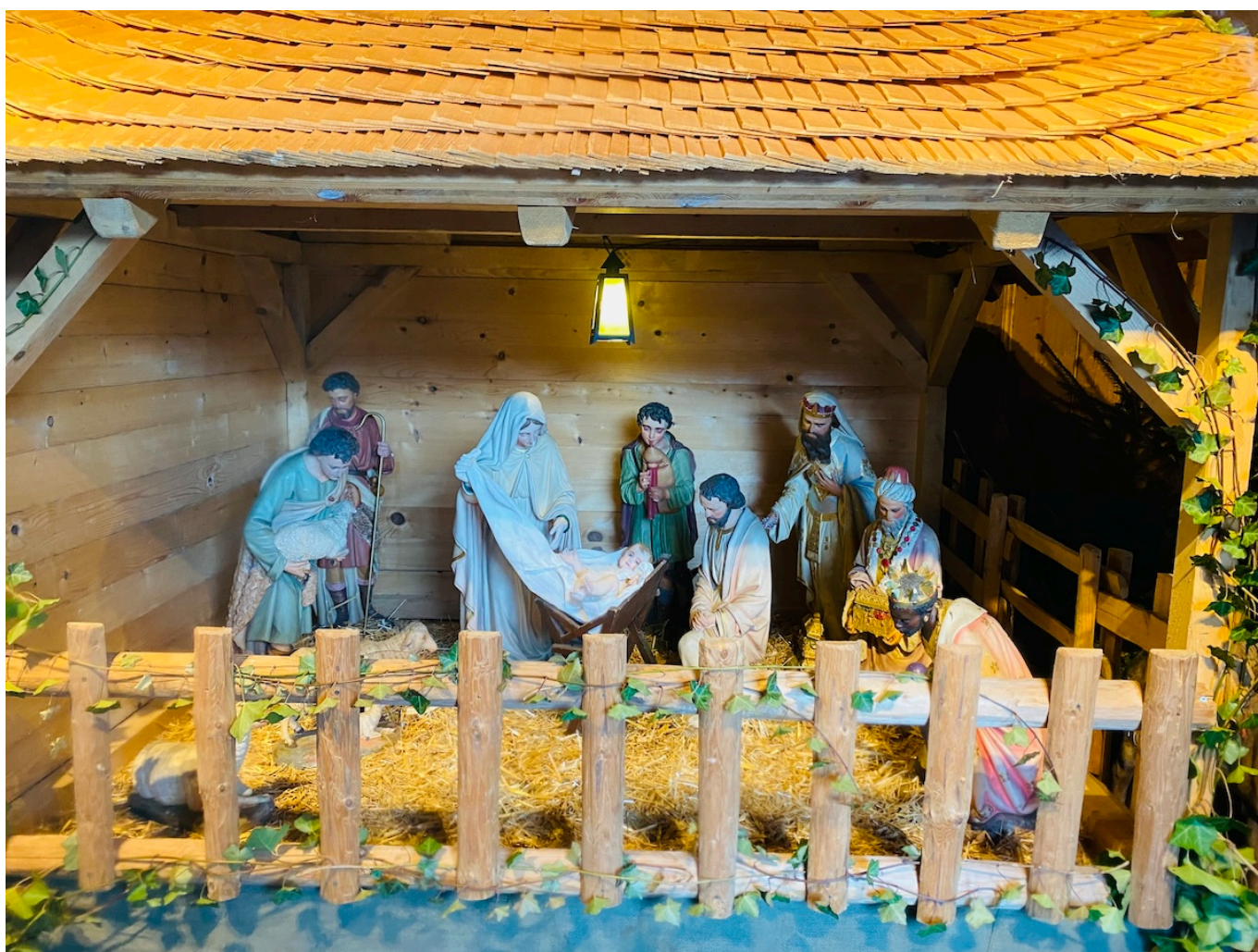
Рождественский вертеп в церкви Грюейра. Фото: Nashagazeta.ch

Author: Заррина Салимова, Берн , 03.01.2025.