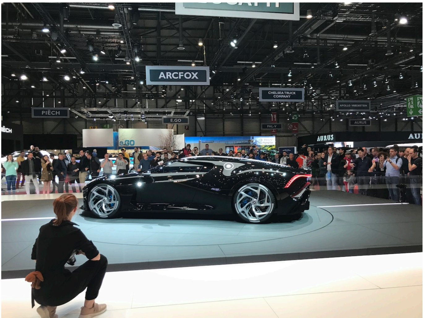
La Voiture Noire от Bugatti на Женевском автосалоне в 2019 году.

С 1982 года салон проводился в Palexro, достигнув пика в 2005 году, когда 747 000 человек приехали в Женеву, чтобы увидеть мировую премьеру Alpha Romeo Wreга и Citroën C6. В течение всей своей истории Женевский салон был площадкой для презентации автомобилей, ставших впоследствии культовыми и революционными, например, Jaguar E-Type, который Энцо Феррари считал – и с ним сложно не согласиться! – самым красивым автомобилем в мире, или La Voiture Noire от Bugatti – один из самых дорогих автомобилей в мире, выпущенный в единственном экземпляре.