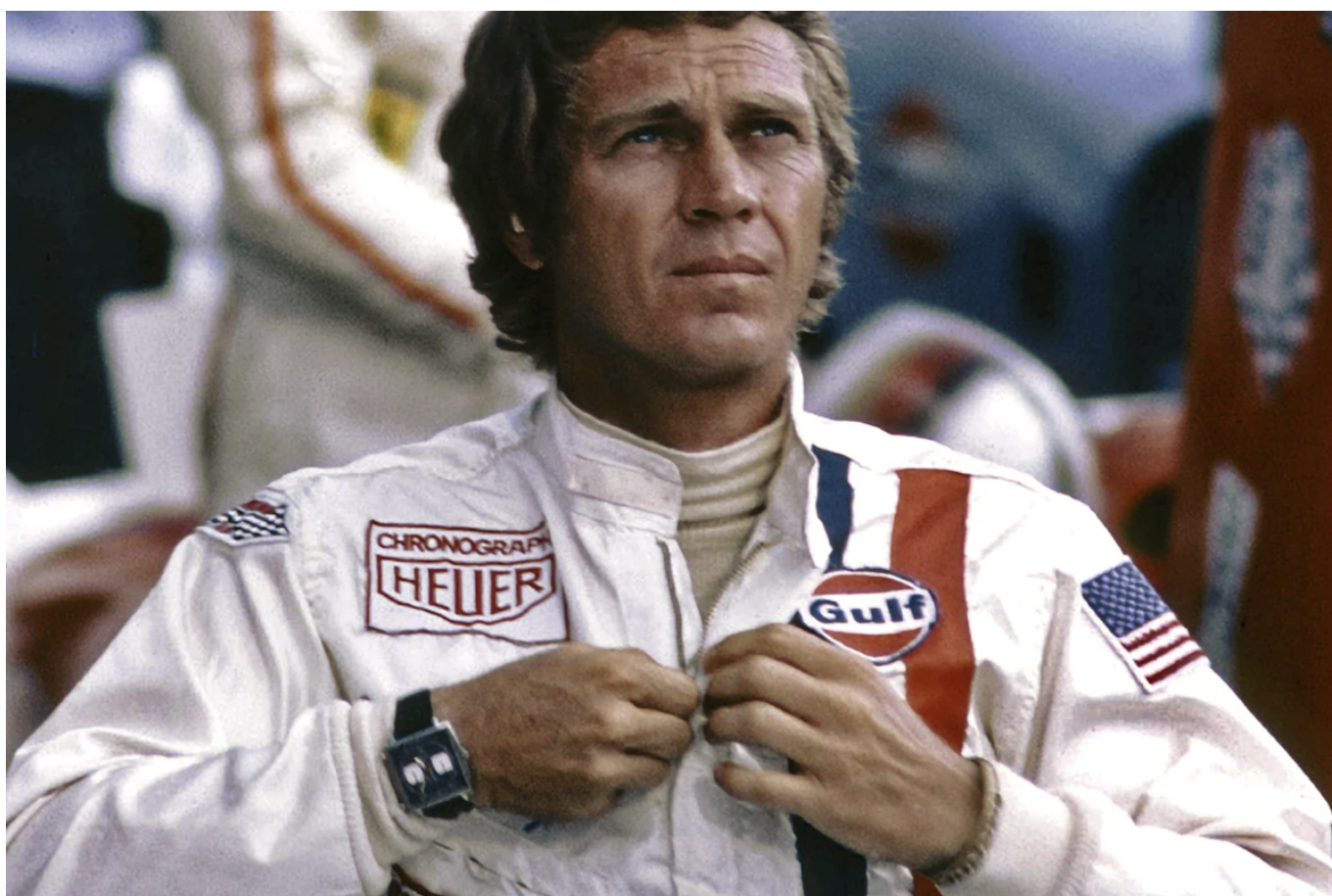
Кадр из фильма «Ле-Ман»

Author: Зарина Салимова, Берн , 30.05.2024.