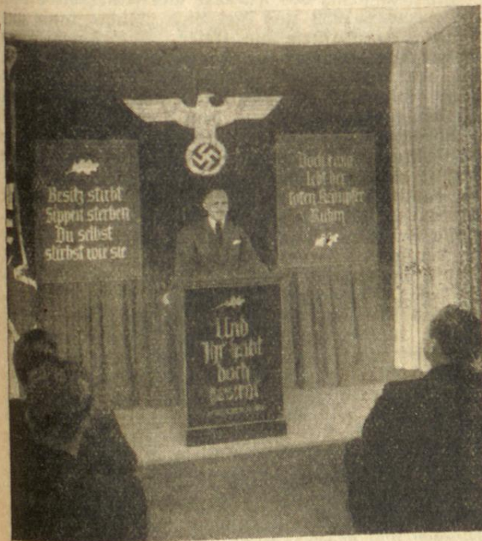
Chur: Pg. Ludwig spricht

Das Gelöbnis des Ortsgruppenleiters, an. Blage im Ringen um den letzten noch au. unserer Gemeinschaft stehenden Deutschen nid. zulassen, und ein begeistertes Sieg-Heil a. Führer schlossen die Feier.