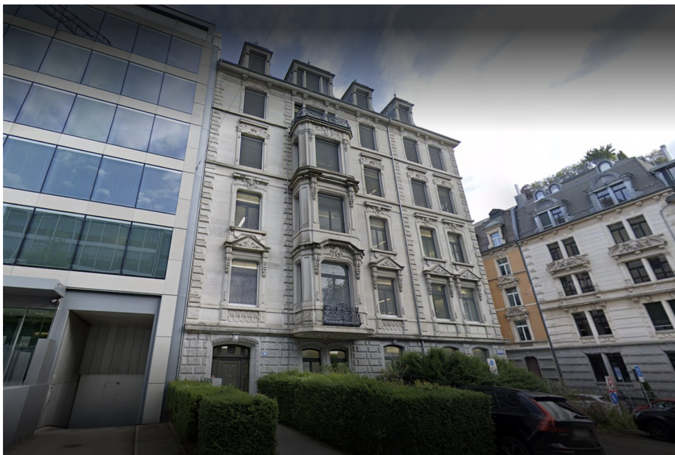
Цюрихский офис TradeXbank. Скриншот Google Maps

Author: Заррина Салимова, Женева-Цюрих , 22.05.2024.