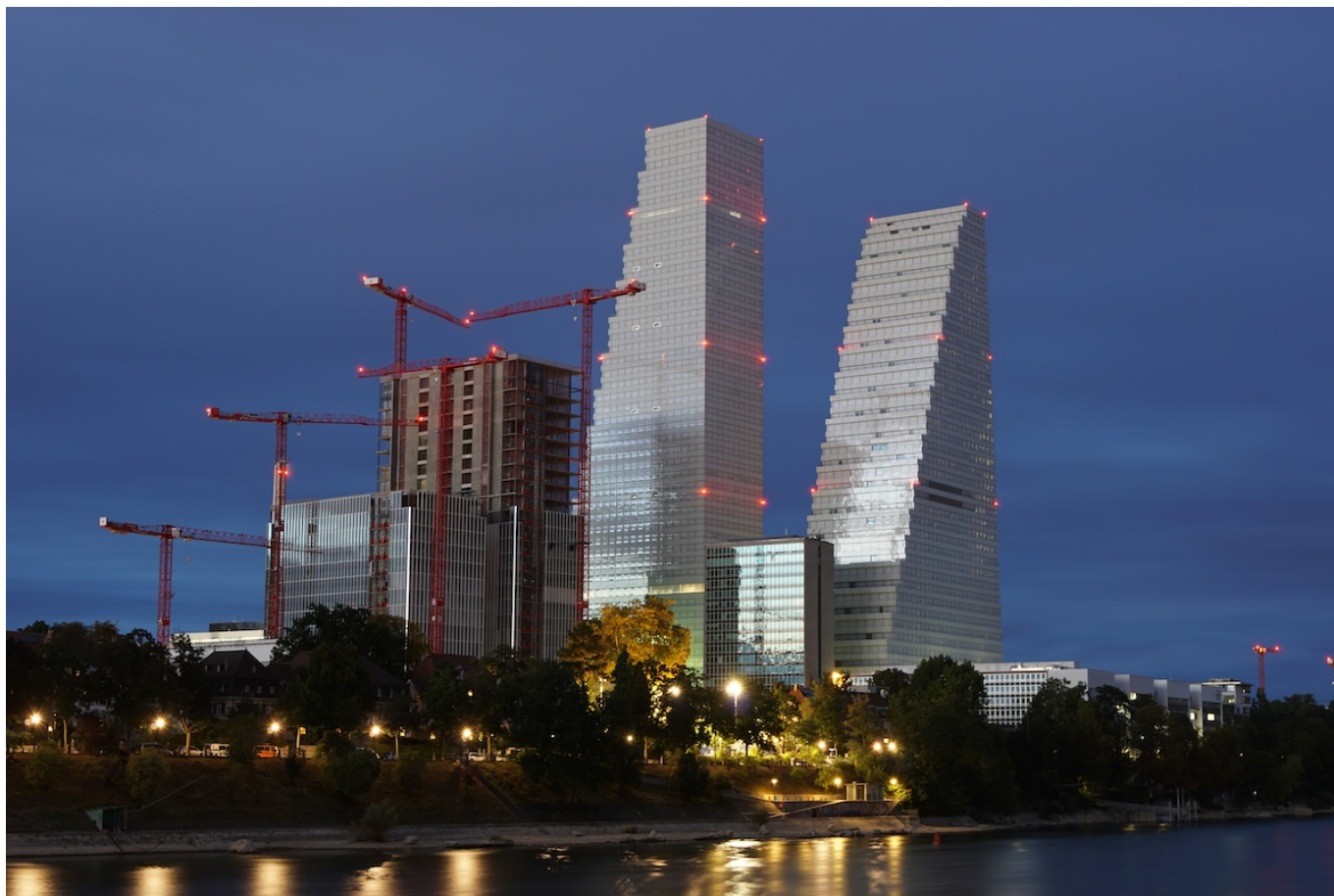
Башни Roche в Базеле.

Author: Заррина Салимова, Базель , 20.02.2024.