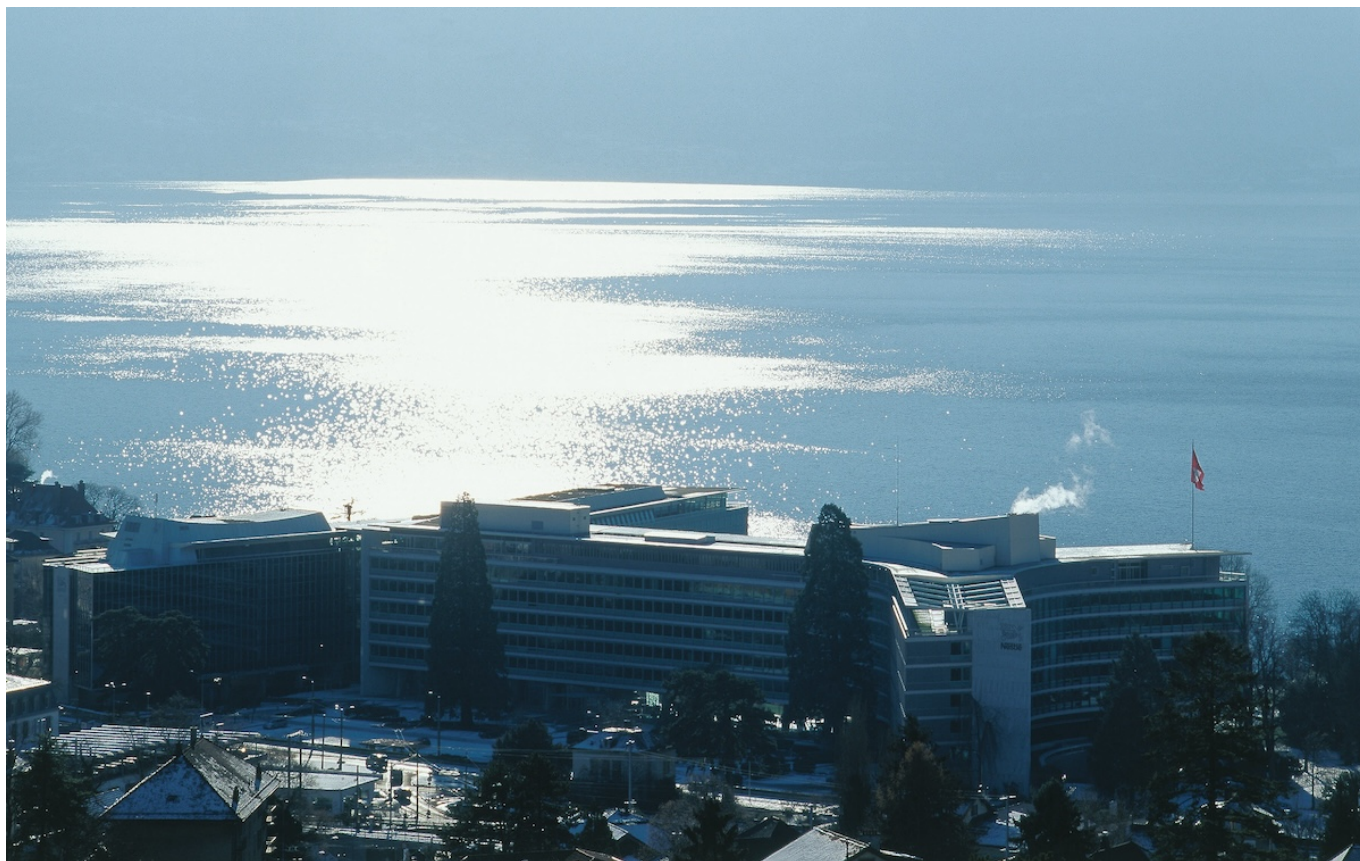
Штаб-квартира Nestlé в Ве́ве (с) Nestlé

Author: Заррина Салимова, Ве́ве , 05.02.2024.