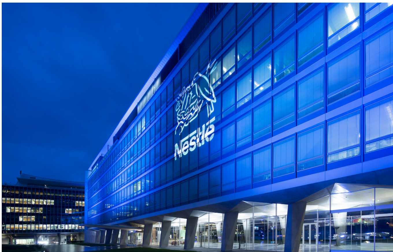
Штаб-квартира Nestlé в Веве

Author: Заррина Салимова, Берн , 09.01.2024.