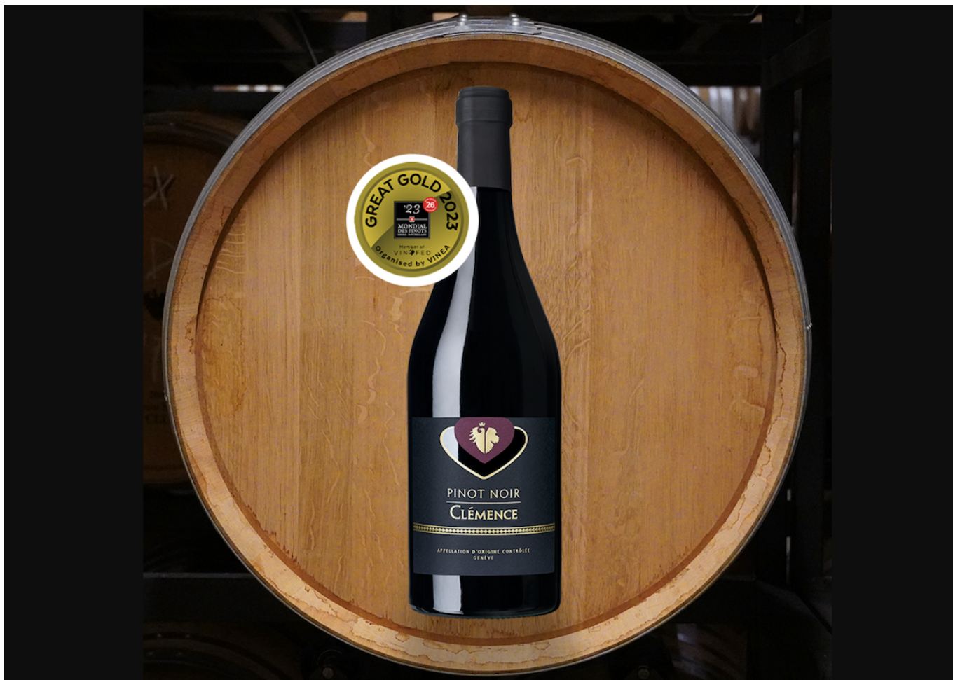
Фото: La Cave de Genève

Author: Зарина Салимова, Берн , 01.12.2023.