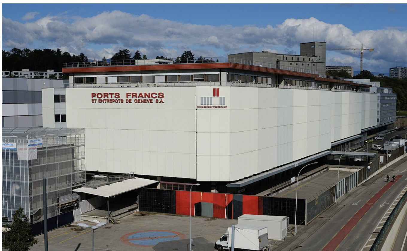
Ports Francs.

Author: Заррина Салимова, Женева , 24.11.2023.